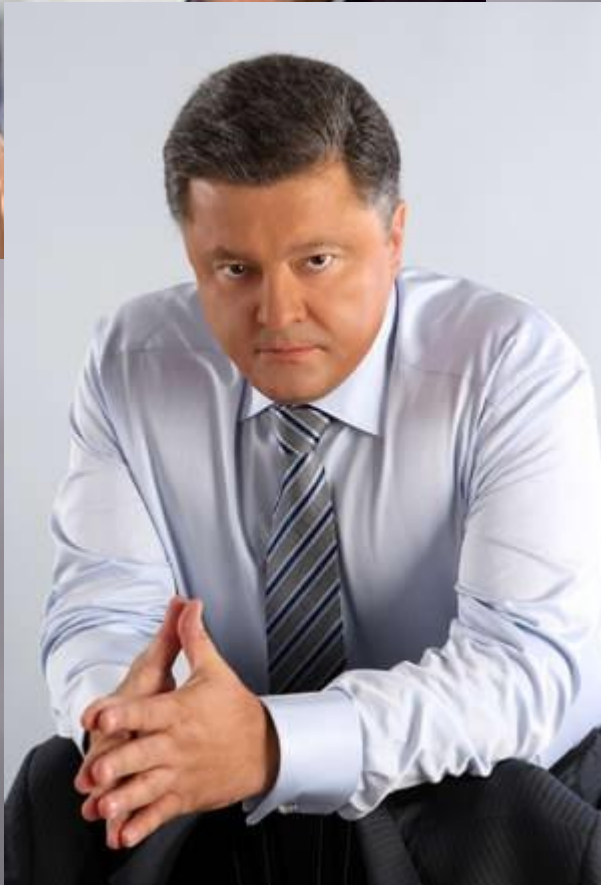
Петро́ Олексі́йович Пороше́нко

Заступник заміщає Голову Ради Національного банку у разі його відсутності або неможливості ним здійснювати свої повноваження та здійснює інші повноваження і функції відповідно до рішень Ради Національного банку.