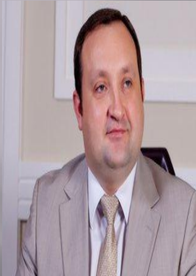
Арбузов Сергій Геннадійович

Правління Національного банку очолює Голова Національного банку.