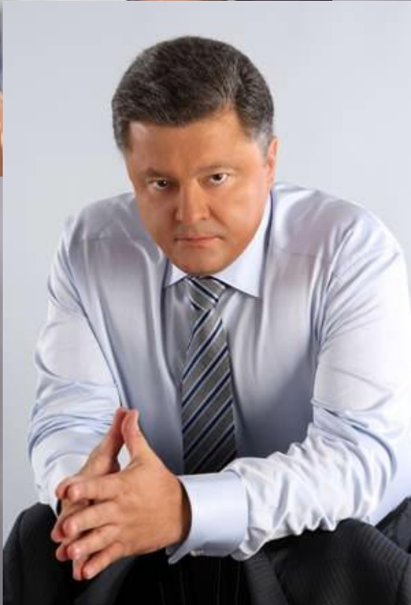
Петро́ Олексі́йович Пороше́нко