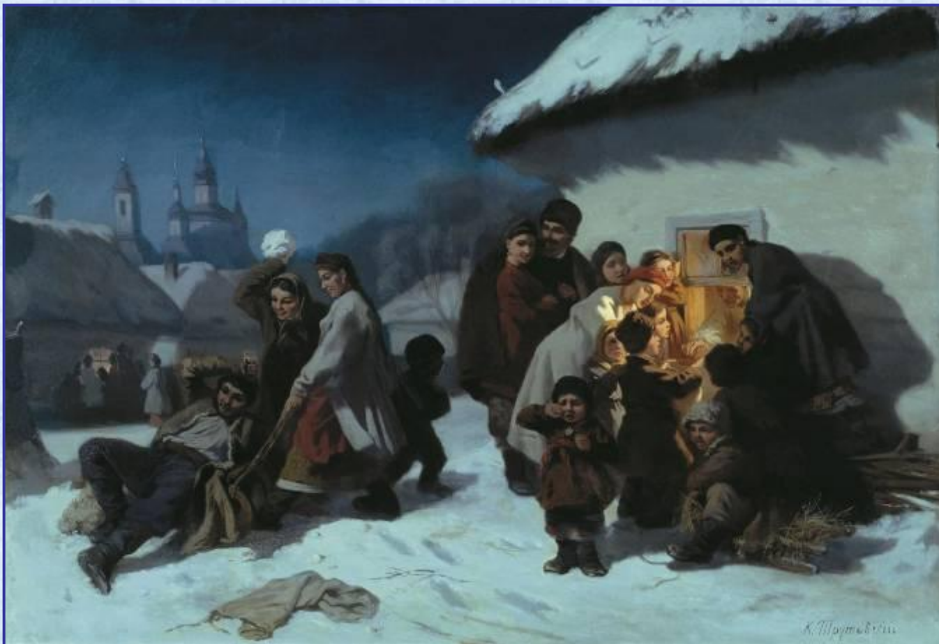
К.Трутовский. Колядки в Малороссии

Святые вечера - время колядок, народных игрищ и христославья.