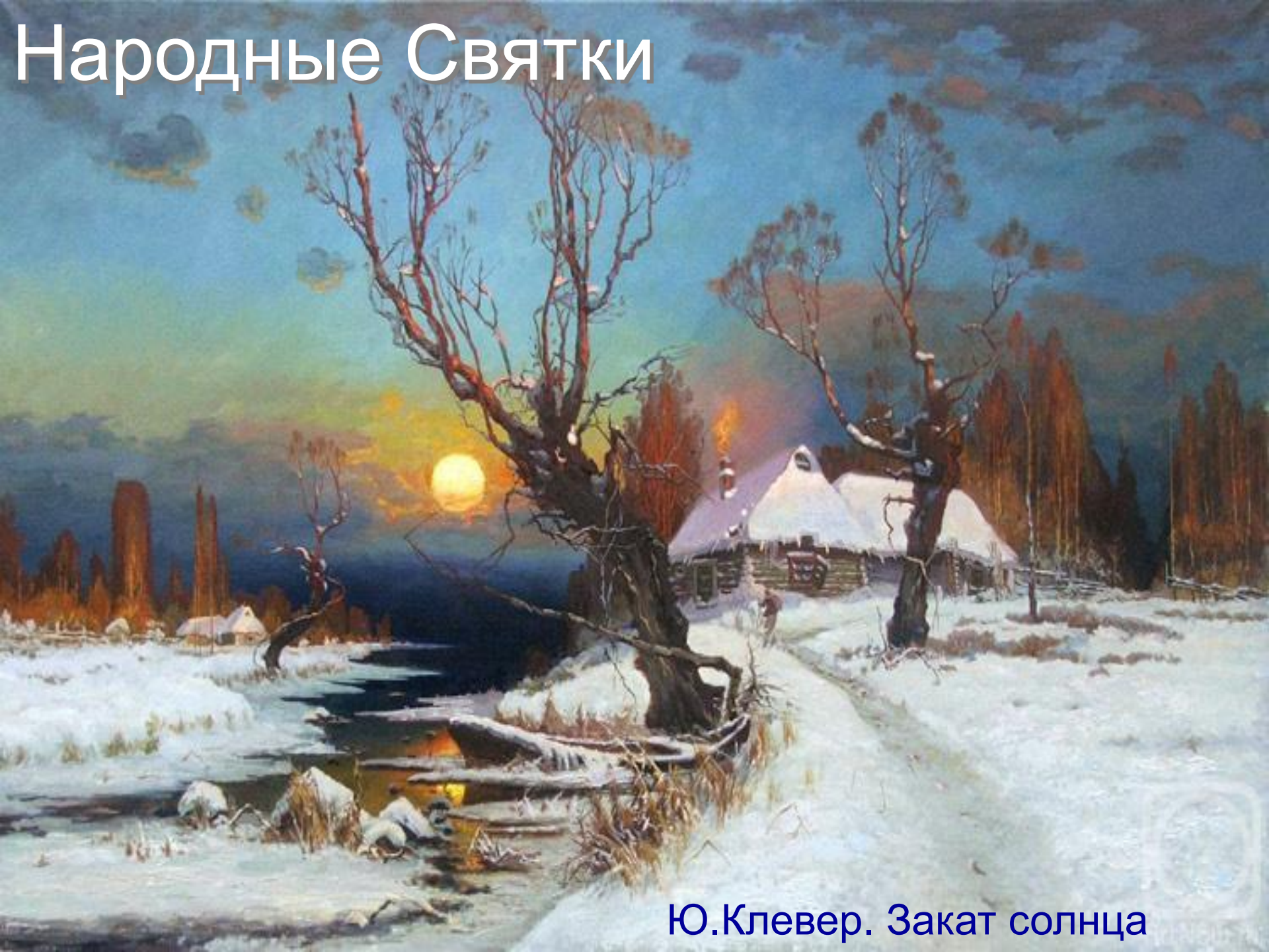
Ю.Клевер. Закат солнца