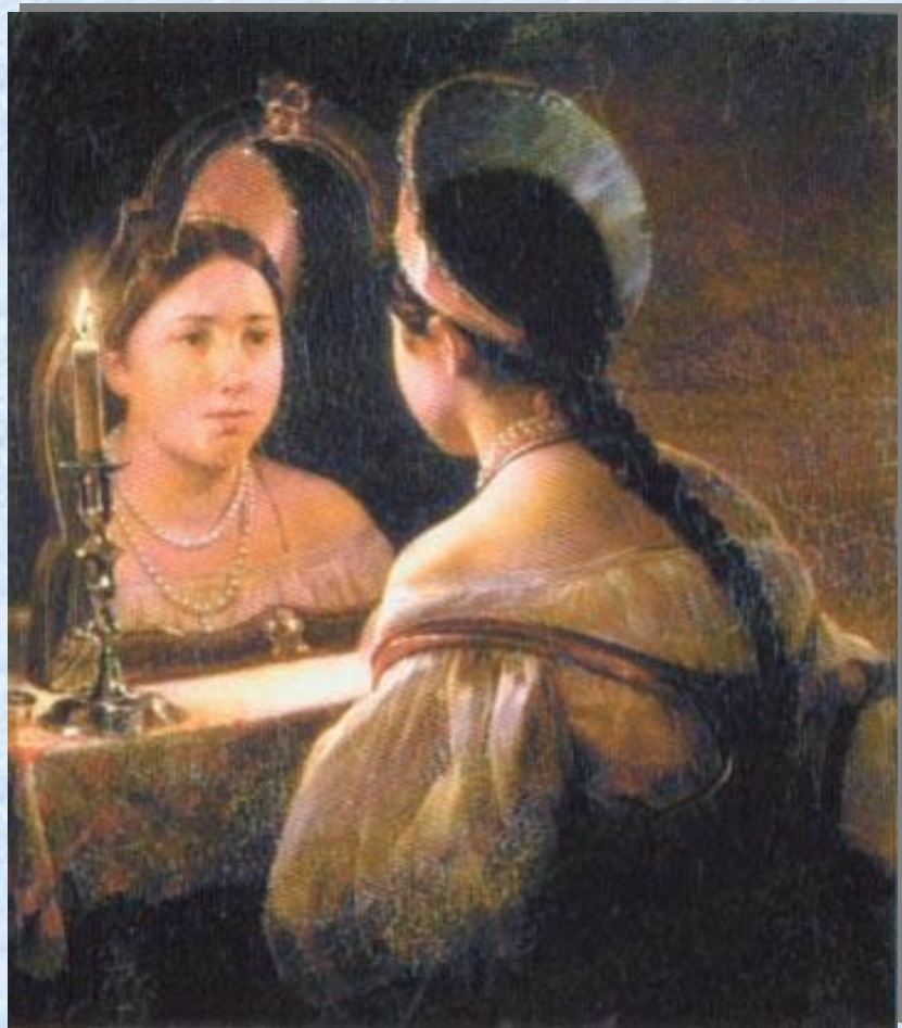
К.Брюллов. Гадающая Светлана

Татьяна любопытным взором На воск потопленный глядит: Он чудно вылитым узором Ей что-то чудное гласит; Из блюда, полного водою, Выходят кольца чередою; И вынулось колечко ей Под песенку старинных дней: «Там мужики-то всё богаты, Гребут лопатой серебро, Кому поем, тому добро И слава!..»