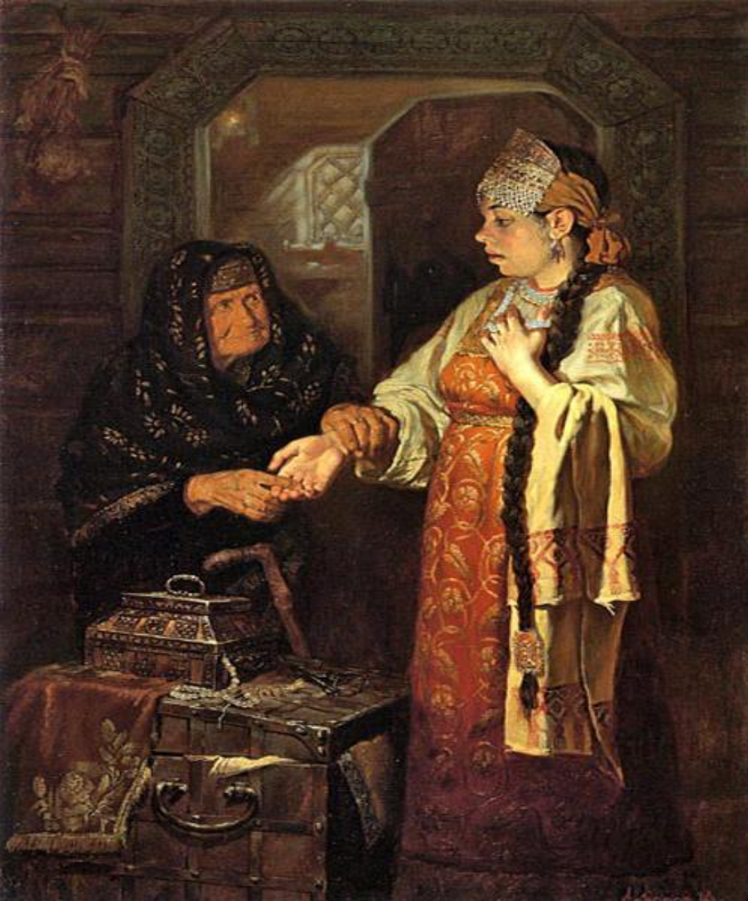
Ю.Сергеев. Ночное гадание. Святки