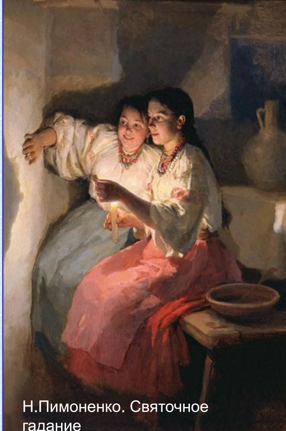
Н.Пимоненко. Святочное гадание