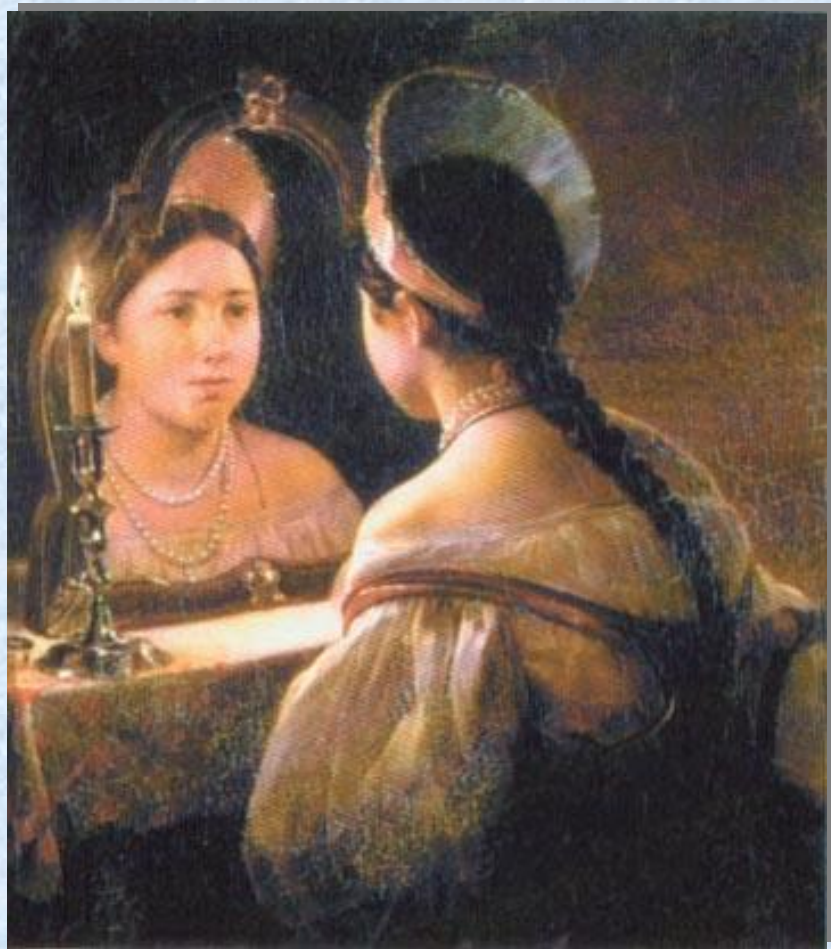
К.Брюллов. Гадающая Светлана

Татьяна любопытным взором На воск потопленный глядит: Он чудно вылитым узором Ей что-то чудное гласит; Из блюда, полного водою, Выходят кольца чередою; И вынулось колечко ей Под песенку старинных дней: «Там мужики-то всё богаты, Гребут лопатой серебро, Кому поем, тому добро И слава!..»