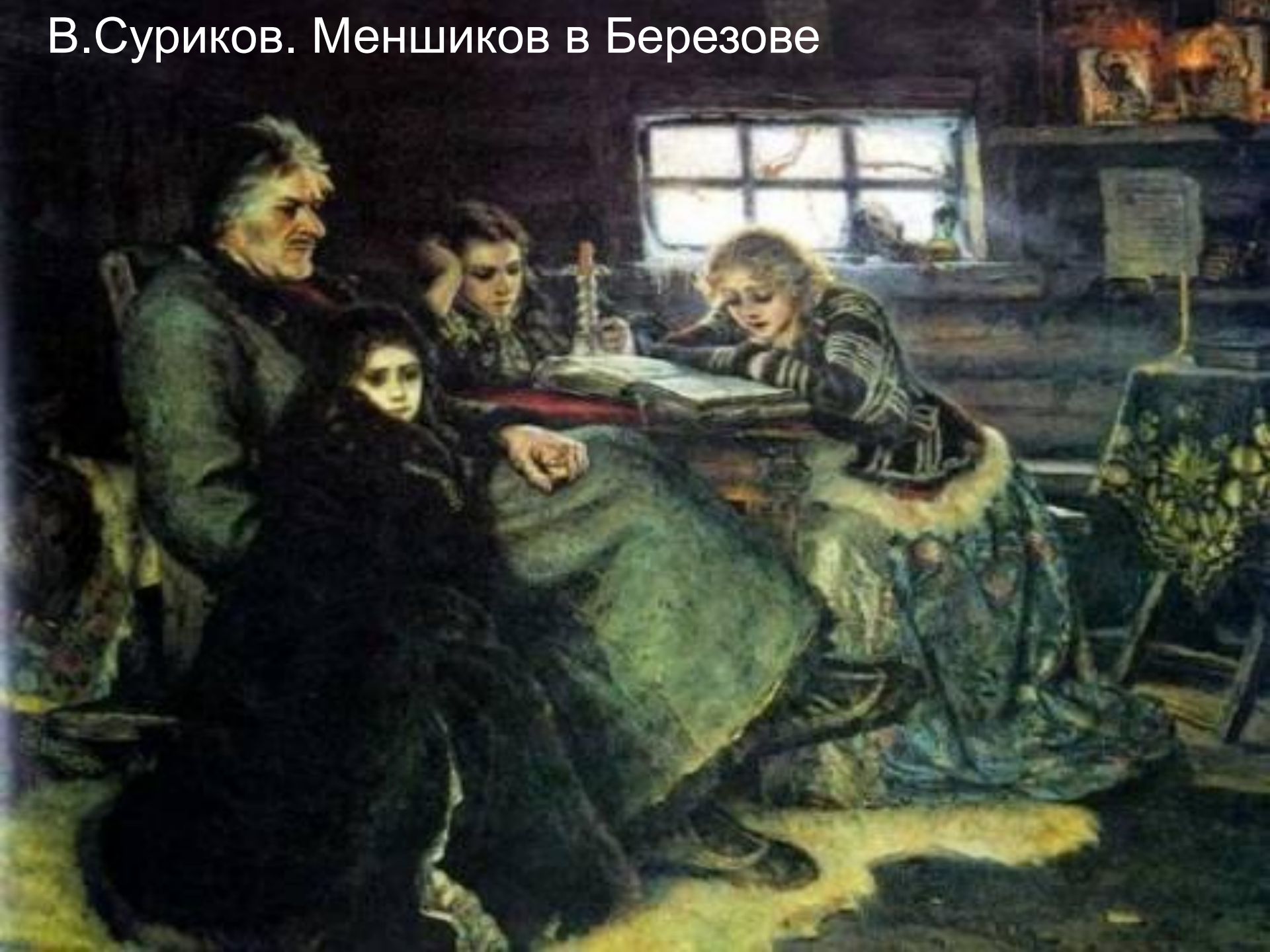
В.Суриков. Меншиков в Березове