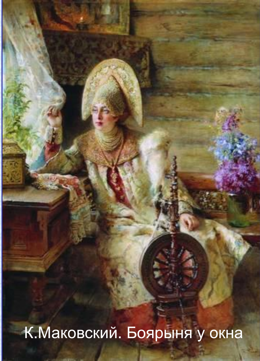
К.Маковский. Боярыня у окна