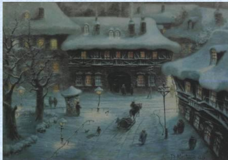
В.Суриков. Деревенская божница

Огонек в душе давно затоптали Будни властью карусельной своей, Но в такие вечера – замечали? Звезды кажутся ближе людей! Ведь сейчас души раскрыты дверцы - Не в пещере, в яслях, под звездой - пусть Иисус сперва родится в сердце Каждого ... Но — погоди! Постой! Тише! Видишь — круг луны закачался, Резонансом прозвенело в груди - Тише, тише! — то Христос постучался, Открывай скорее сердце – впусти!