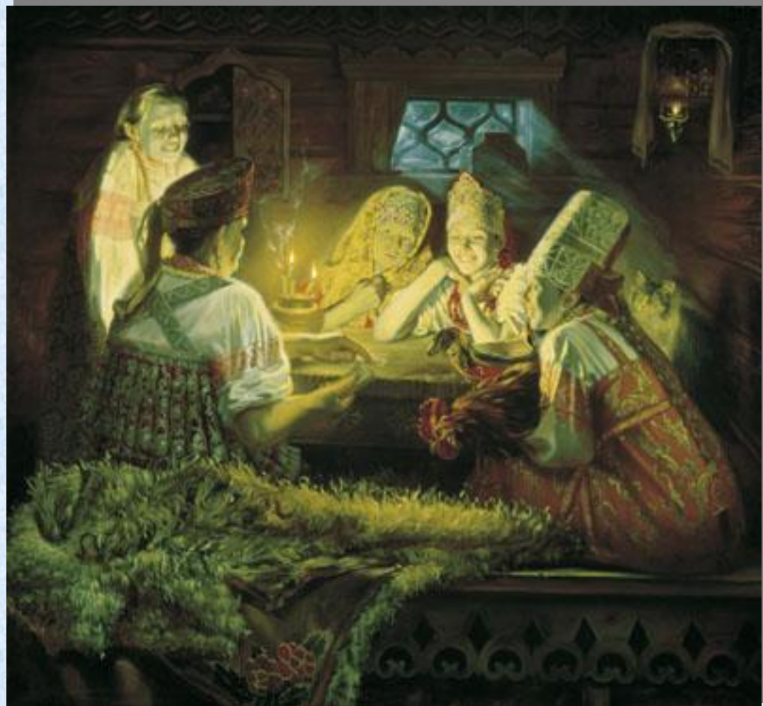
Ю.Сергеев. Ночное гадание. Святки