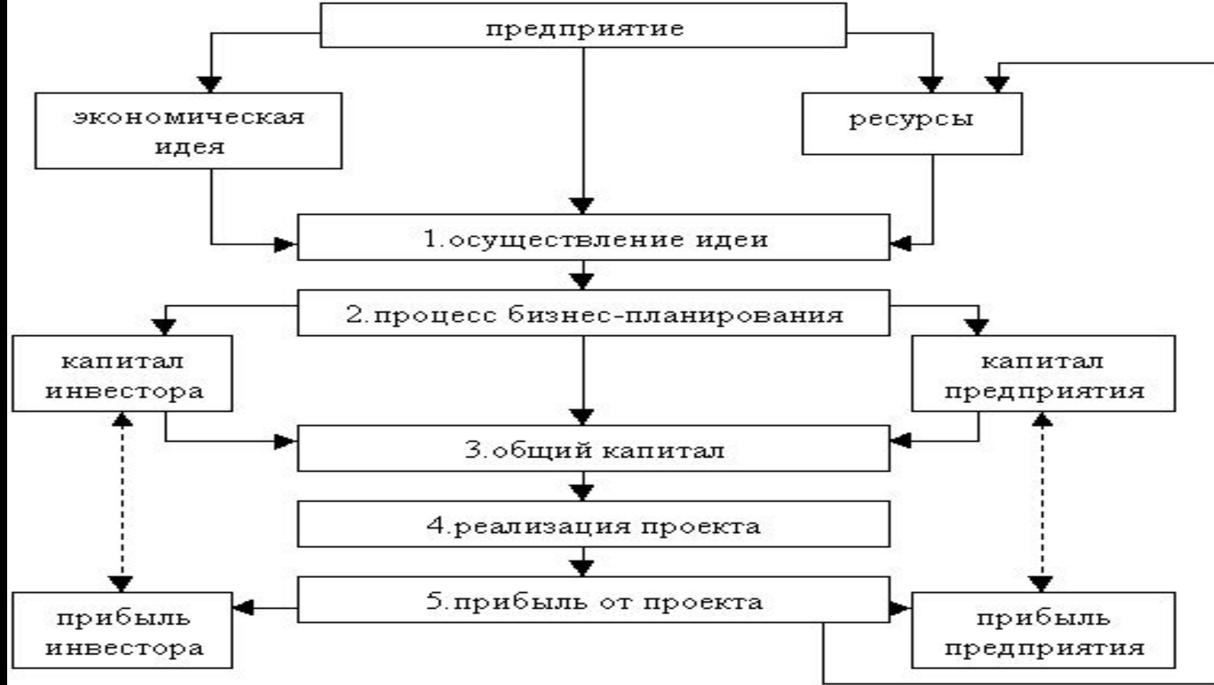
рис.1 Структура предприятия .