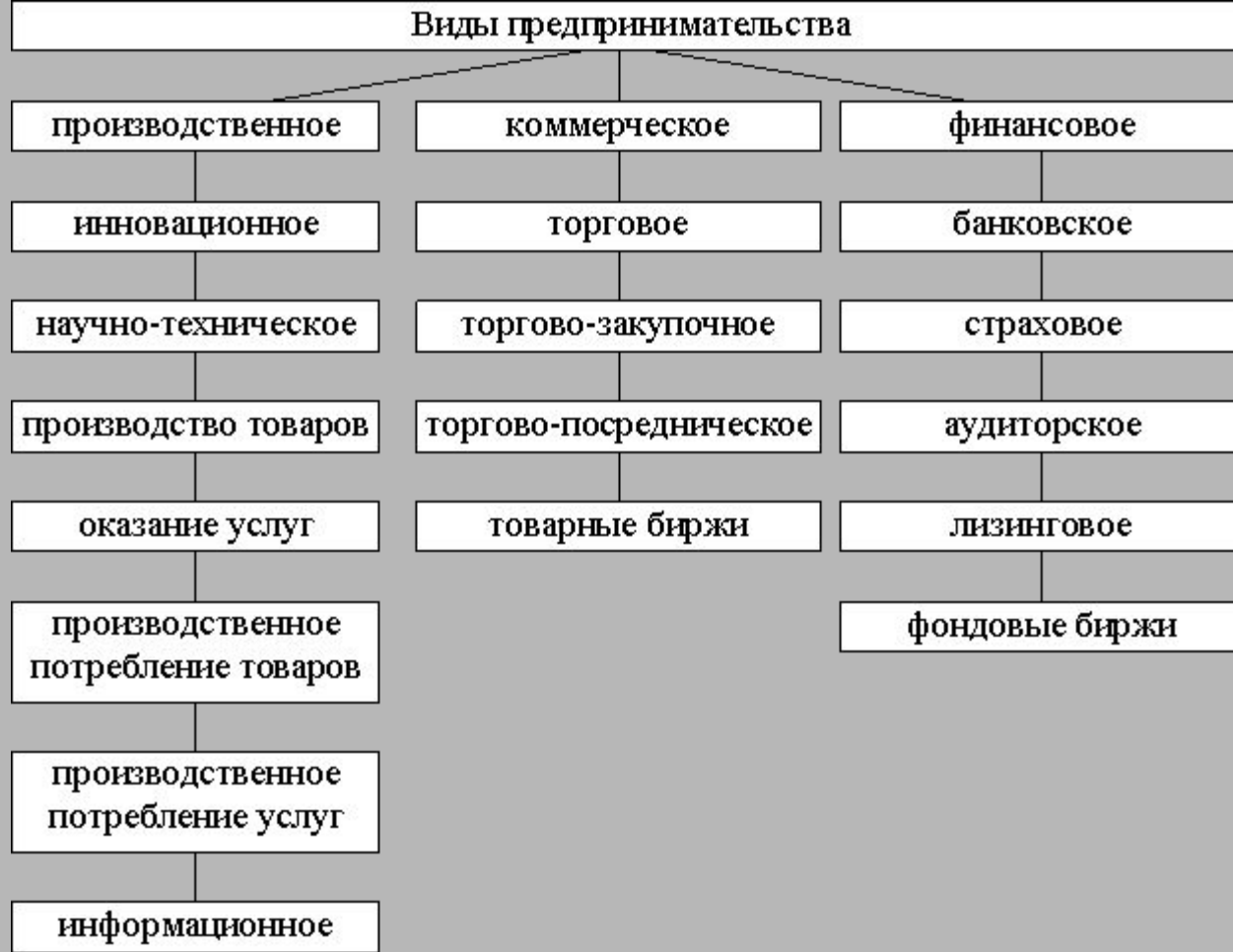
Рис. 6 Виды предпринимательства