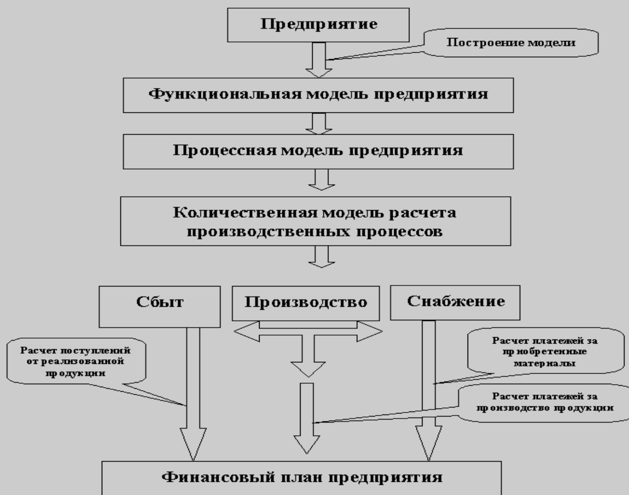
Рис.2 Построение модели предприятия