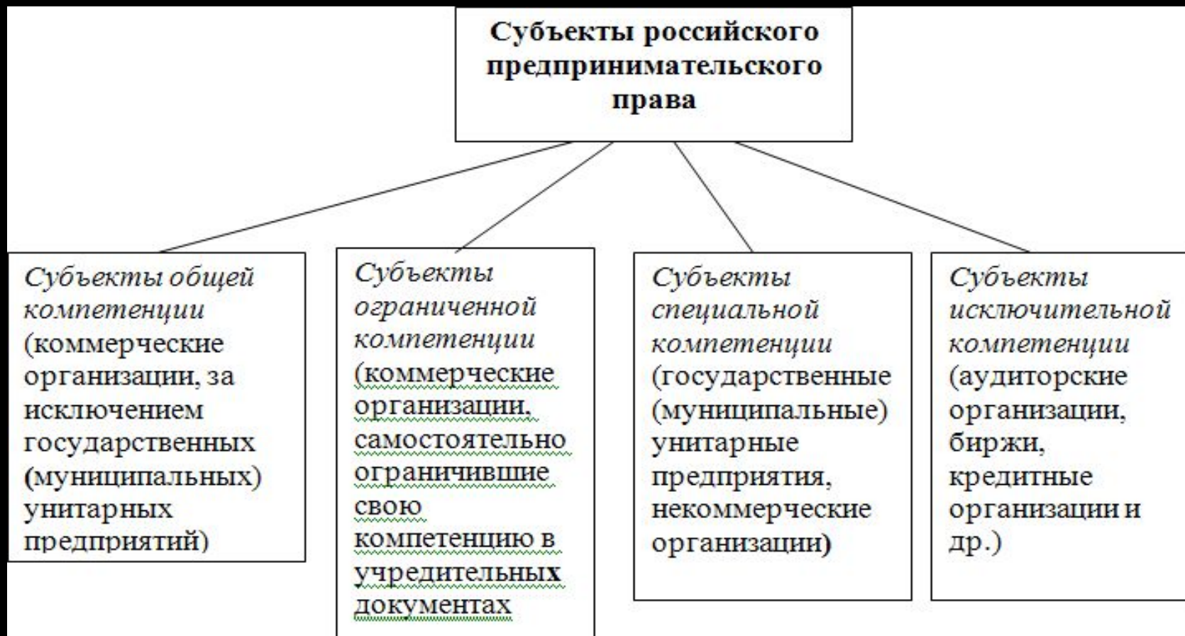
Рис.4 Субъекты российского предпринимательского права.