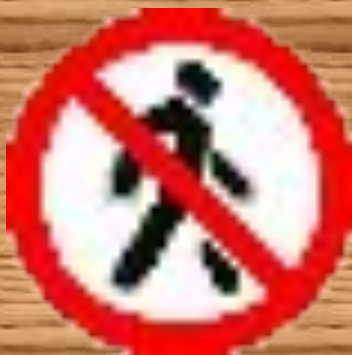
Движение пешеходов запрещено