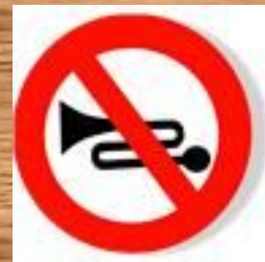
Подача звукового сигнала запрещена