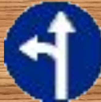
Движение прямо или налево