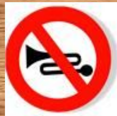
Подача звукового сигнала запрещена