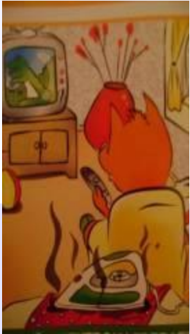
Забывчивость (забыл выключить)