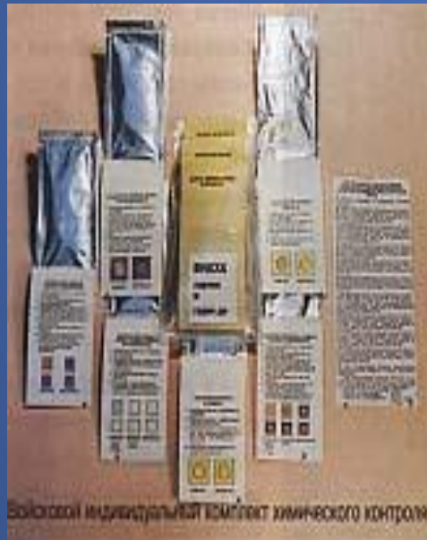
Боевой индивидуальный комплект химического контроля