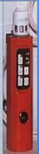
Индивидуальный автоматический газосигнализатор