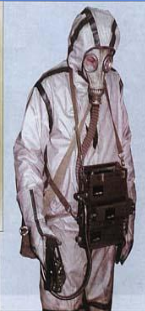
Универсальный прибор газового контроля