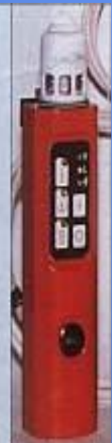
Индивидуальный автоматический газосигнализатор