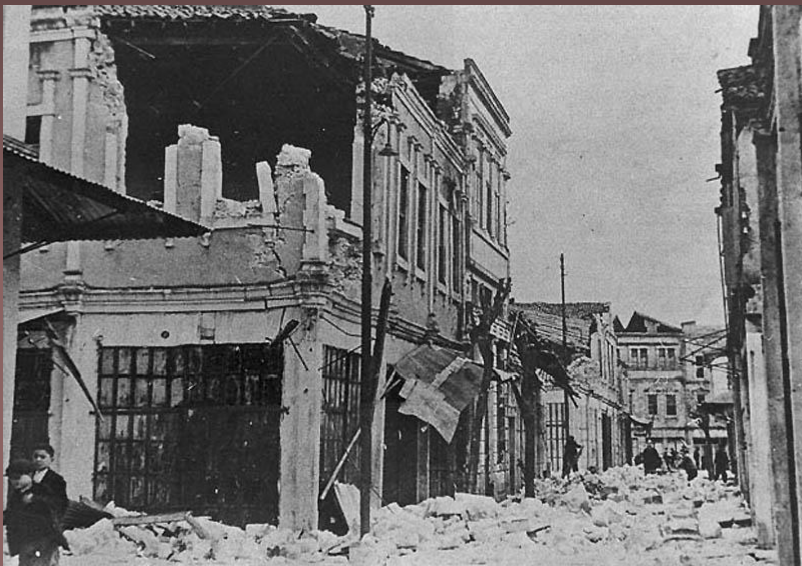
6. 26 декабря 1939 год Эрзинджан, Турция. Этому городу регулярно приходится переживать мощные землетрясения. В 1939 году стихия унесла жизни от 36 до 39 тысяч человек