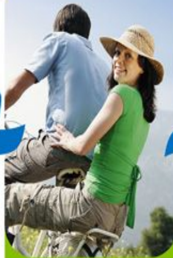
Активный образ жизни