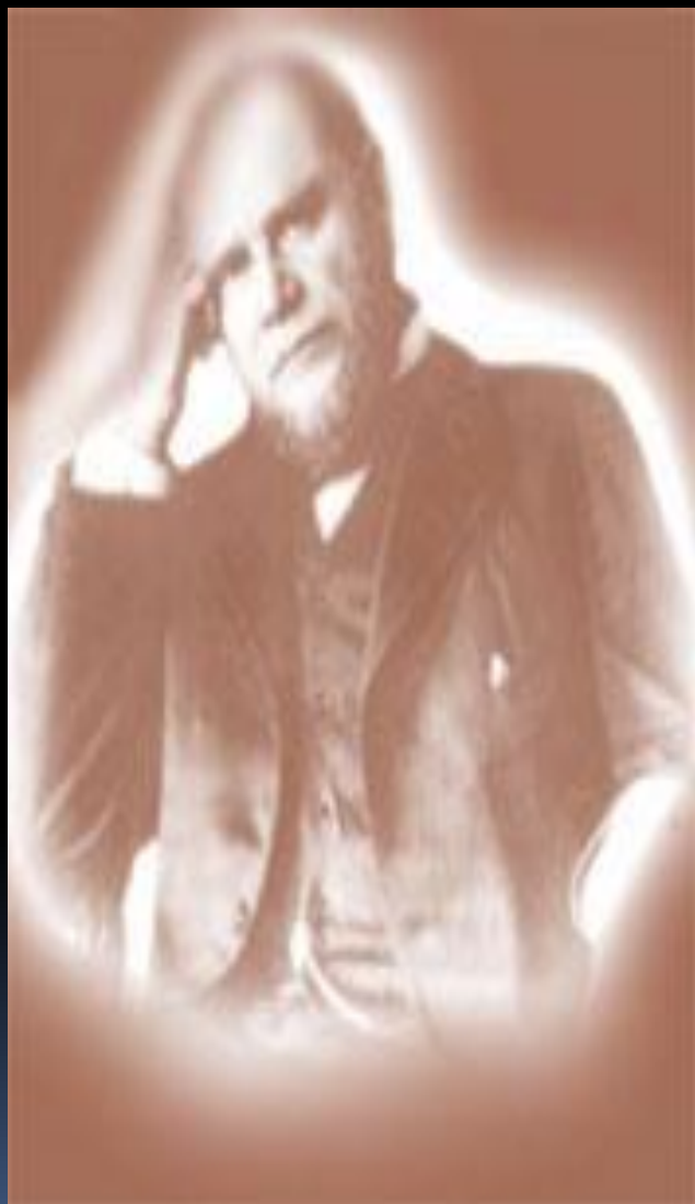
Кони Анатолий Федорович (1844-1927)

Ушедшие в себя эгоисты обыкновенно очень долго живут.