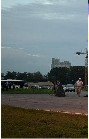
Ragulin Vitaly | dervishv.livejournal.co