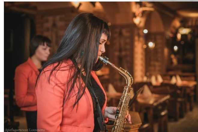
В РЕСТОРАНЕ ИЛИ КАФЕ