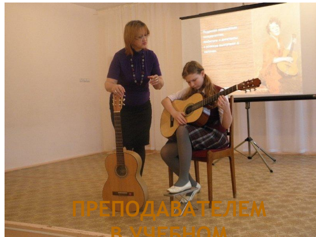
ПРЕПОДАВАТЕЛЕМ В УЧЕБНОМ ЗАВЕДЕНИИ