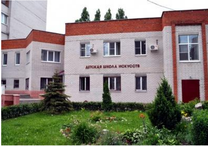
музыкальная школа (школа искусств)