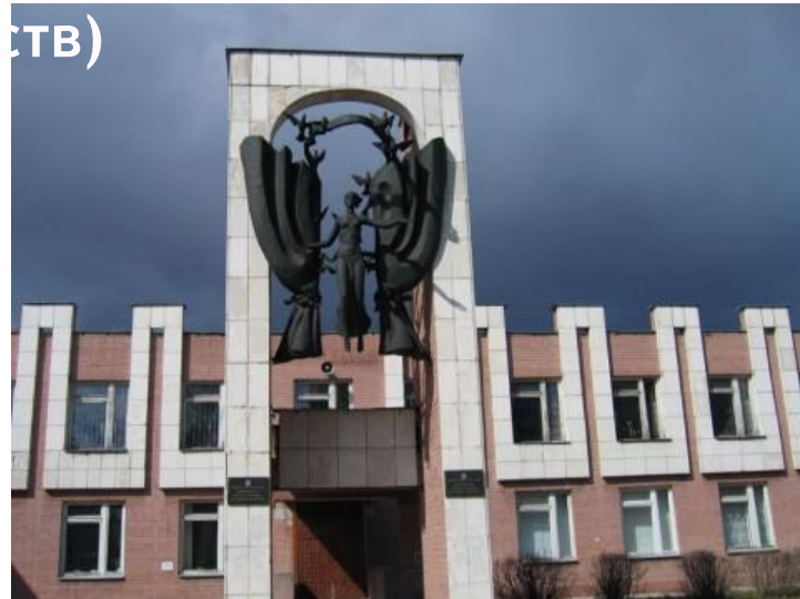
академия искусств или консерватория