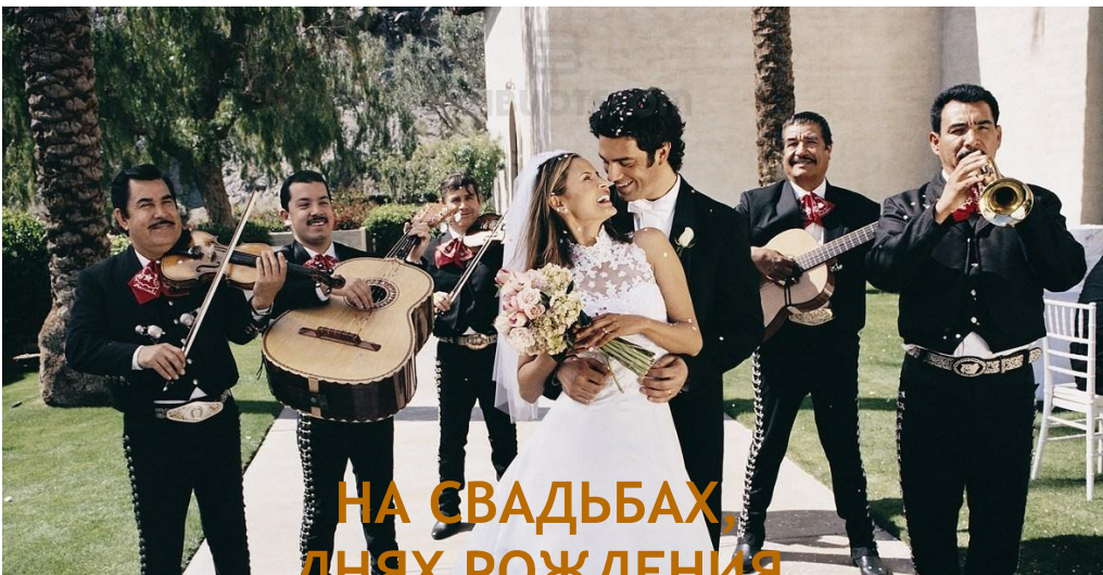
НА СВАДЬБАХ, ДНЯХ РОЖДЕНИЯ И ДРУГИХ ПРАЗДНИКАХ