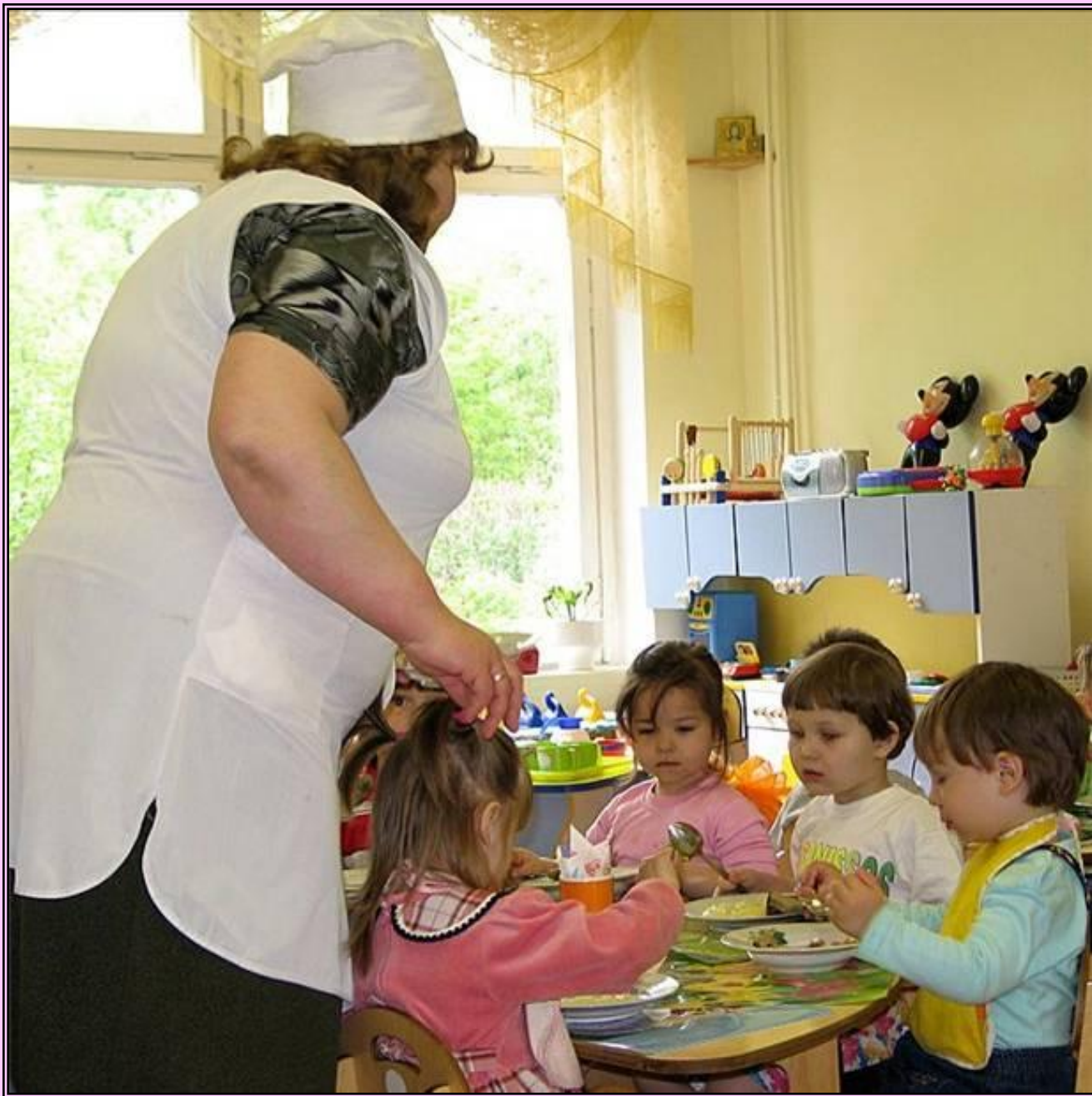
Повара работают в детских садах...