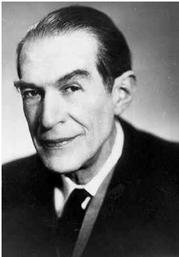
А. Н. Леонтьев