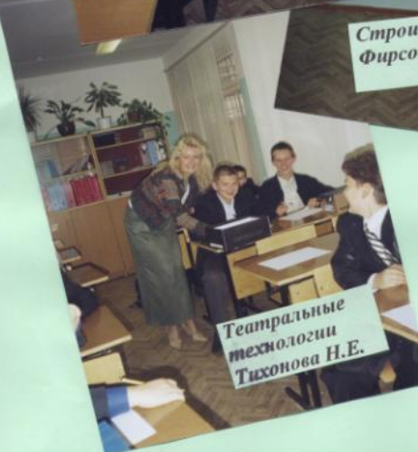
Театральные технологии Тихонова Н.Е.