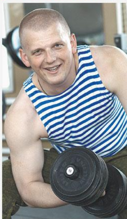
Российские Вооружённые силы наращивают мускулы.

*Минимальная сумма в месяц **С учётом выслуги лет