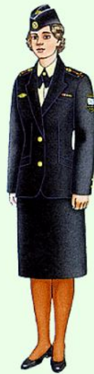
Летняя повседневная вне строя в ВМФ