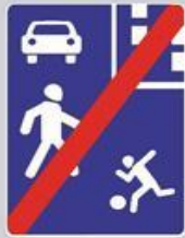
5.22 Конец жилой зоны