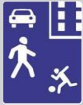
5.21 Жилая зона