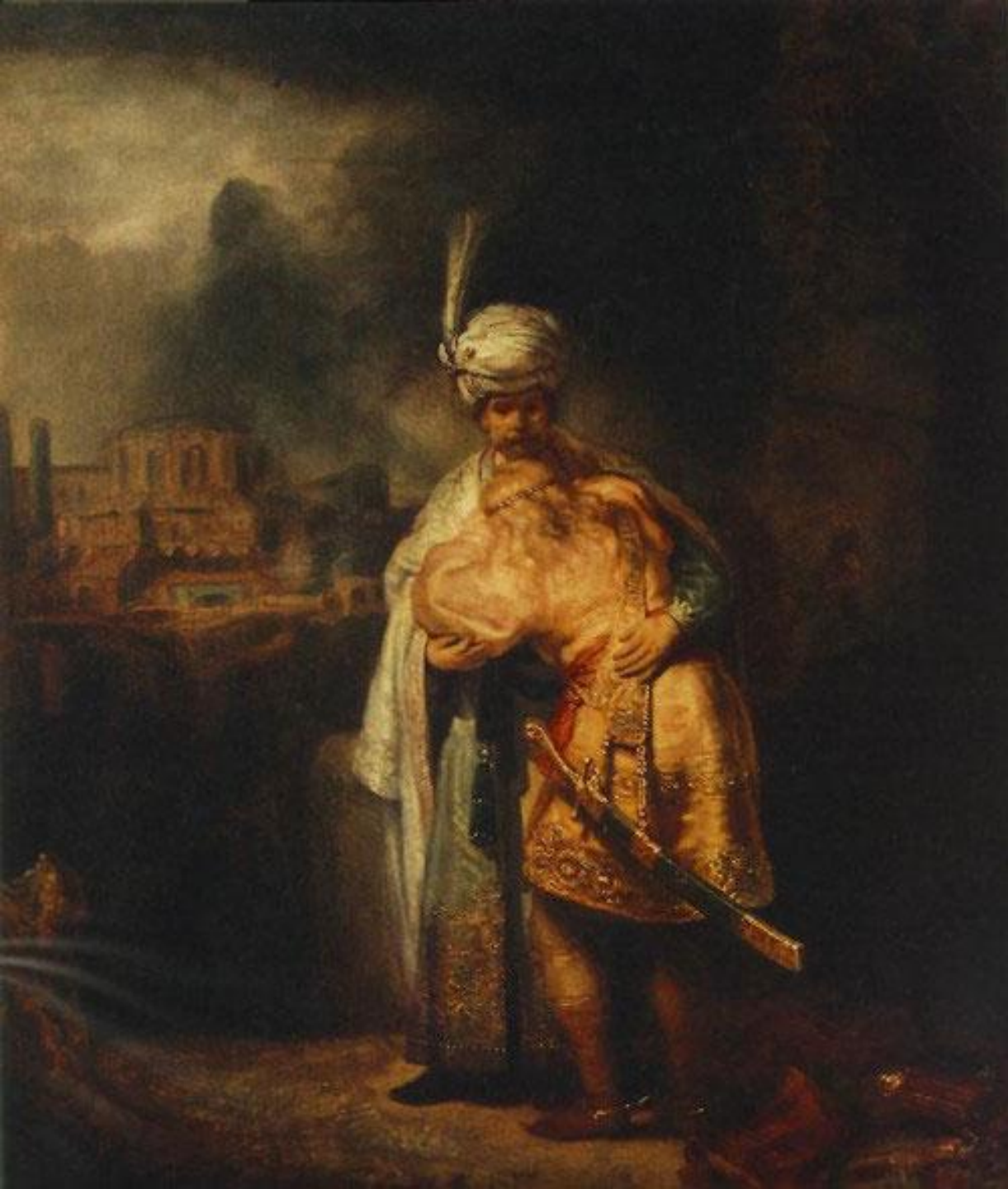
Рембрандт «Давид и Ионафан»