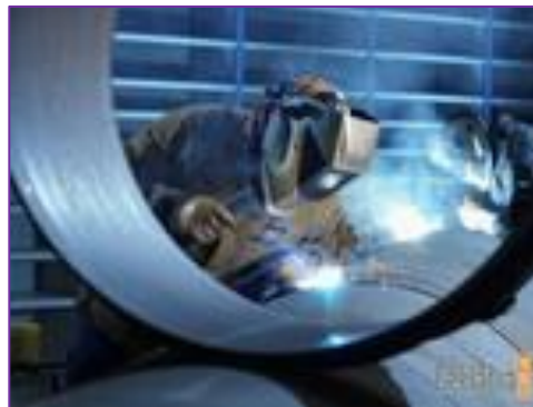
Монтажник стальных и железобетонных конструкций