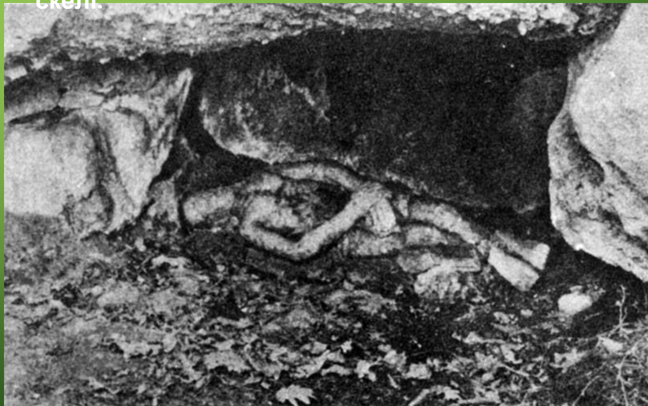
Фігура «Ісус в гробу» біля підніжжя печерної скелі.