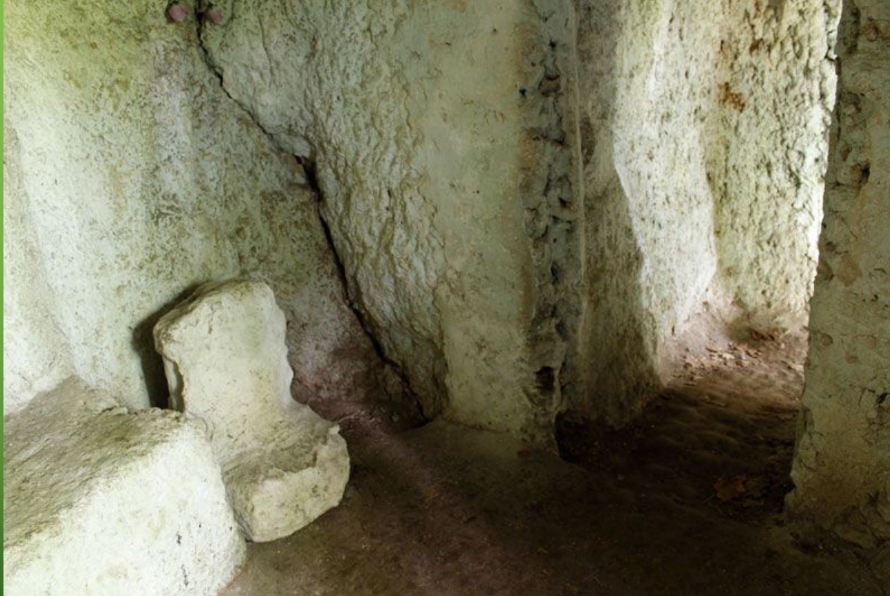
Житлова частина. Ліворуч видно кам'яне ложе, де спав святий старець.