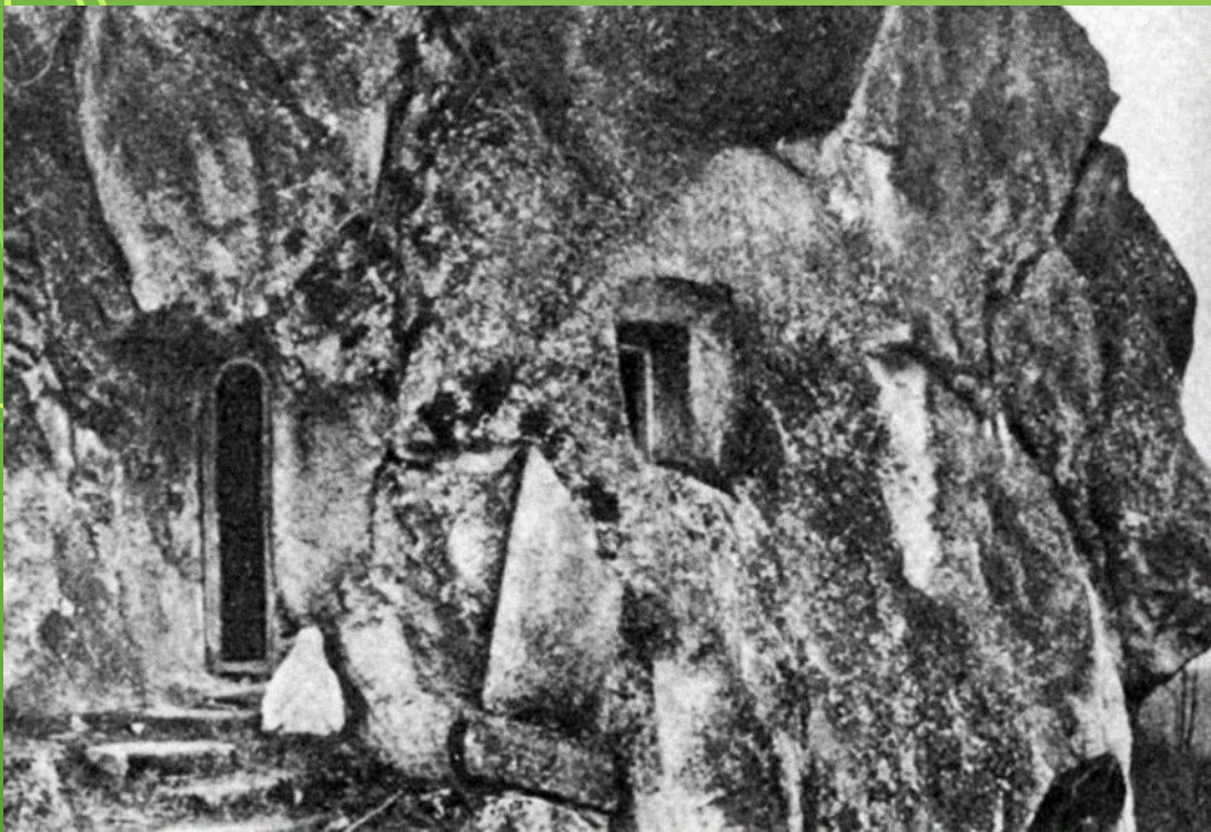
«Печера відлюдника». Світлина 1920-х рр. Біля входу видно фрагмент фігури якогось святого.