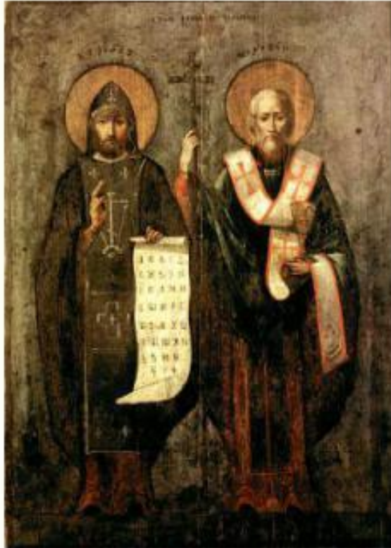
Св. Кирилл и Мефодий

Разница между языческой и христианской Русью - громадна. До крещения на Руси жили в землянках, поклонялись деревянным идолам и не умели читать. Христианство принесло стране первую грамоту – древнерусские люди учились читать по берестяным дощечкам на которых содержался текст Евангелия и Псалтырь. Современный русский и украинский язык основаны на письменности созданной Св. Кириллом и Мефодием специально для чтения Евангелия. Первую школу на территории Киевской Руси открыл христианин Ярослав Мудрый при содействии греческих священников. Первая написанная книга на Руси - Евангелие