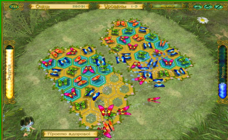
Рис.2 Пример логической игры «Сказочная история»