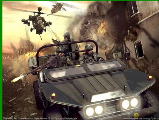
Рис. 1 Пример одной из стратегических игр