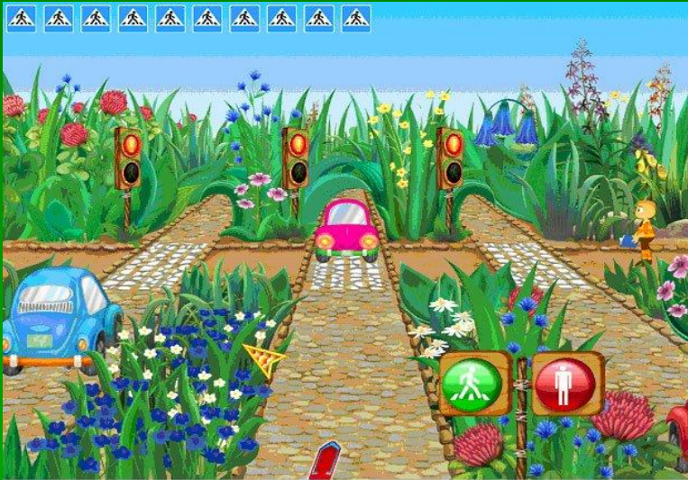
Рис.3 Пример игры-симулятора «Правила дорожного движения»

7) Симуляторы Игра-симулятор имеет в своём названии какую-нибудь приставку, например: авто-, авиа-, спортивный и др.(рис.3)