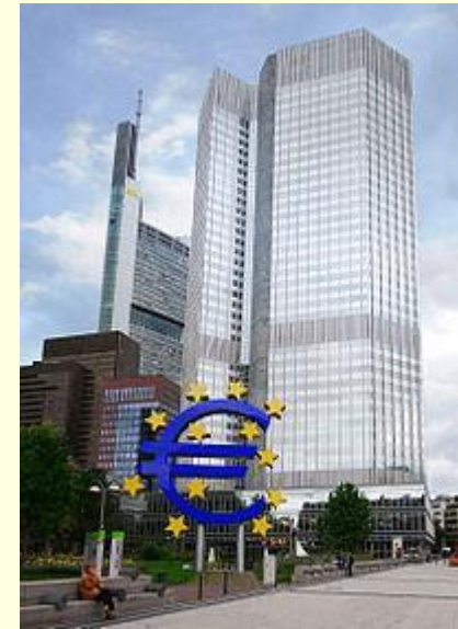
Штаб-квартира ЄЦБ, Франкфурт -на-Майні

Рада керуючих ЄЦБ у листопаді 1998 ввела термін Євросистема , її формують ЄЦБ і національні банки країн-членів, які ввели євро, тобто Євросистема це частина ЄСЦБ де діє євро (на сьогодні це 17 країн ЄС) .