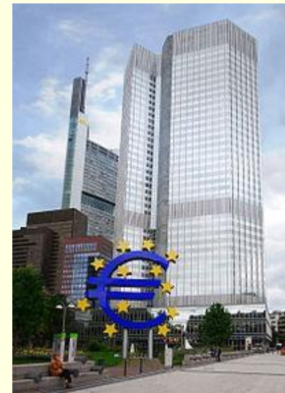
Штаб-квартира ЄЦБ, Франкфурт -на-Майні

Рада керуючих ЄЦБ у листопаді 1998 ввела термін Євросистема , її формують ЄЦБ і національні банки країн-членів, які ввели євро, тобто Євросистема це частина ЄСЦБ де діє євро (на сьогодні це 17 країн ЄС) .