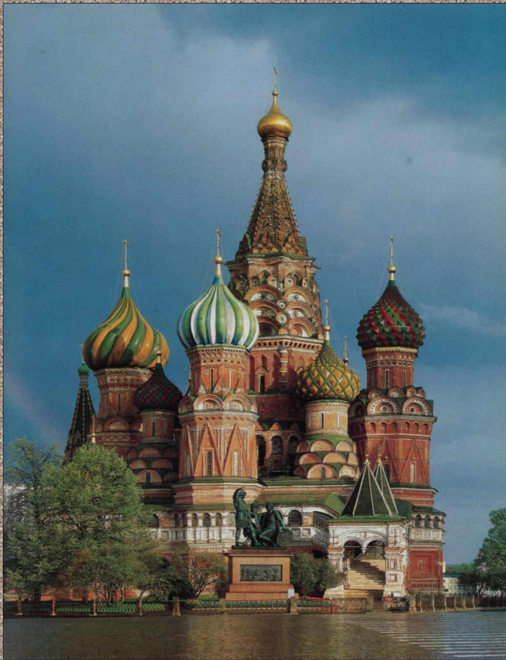
ХРАМ ВАСИЛИЯ БЛАЖЕННОГО