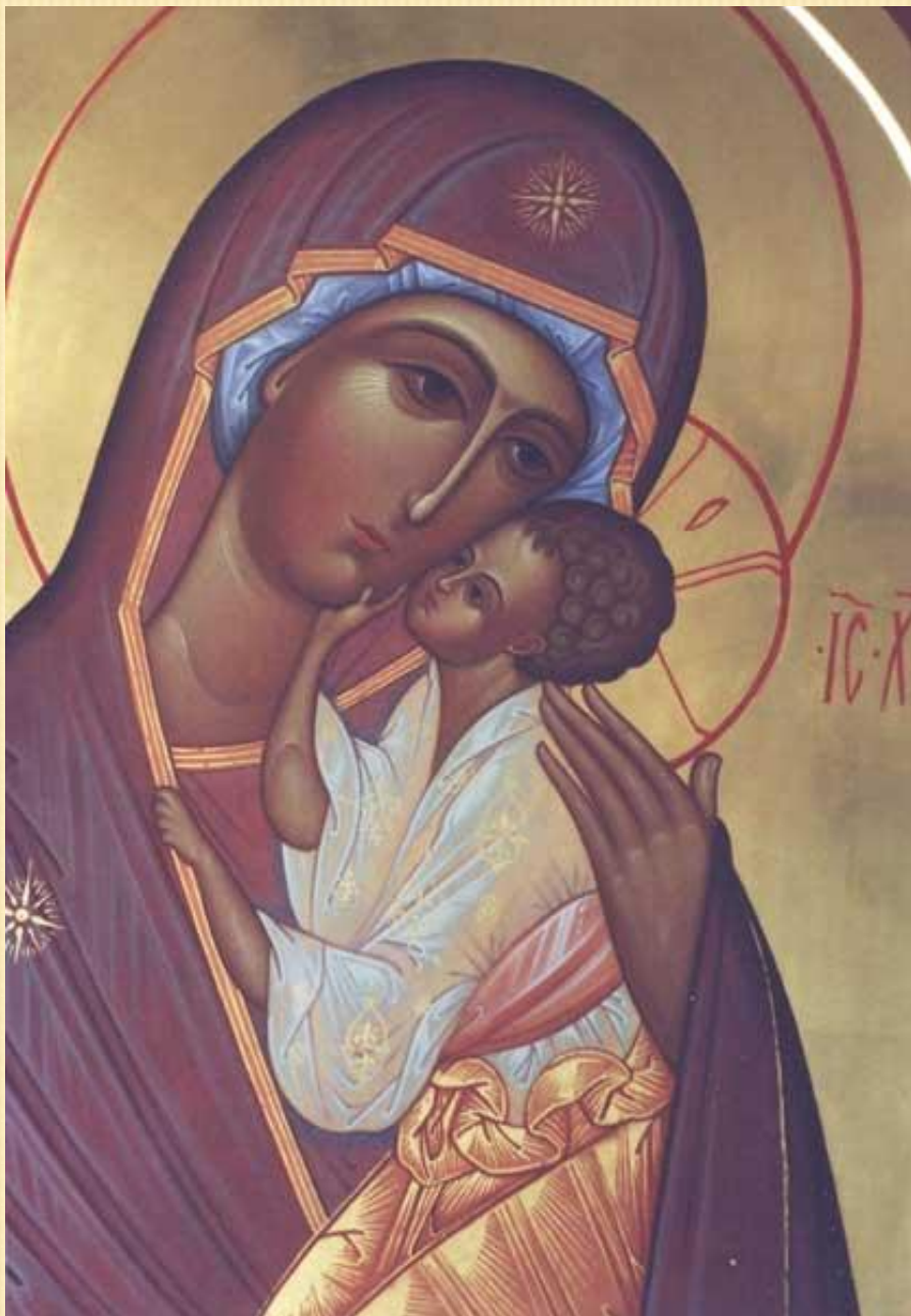
Богоматерь Умиление ярославская