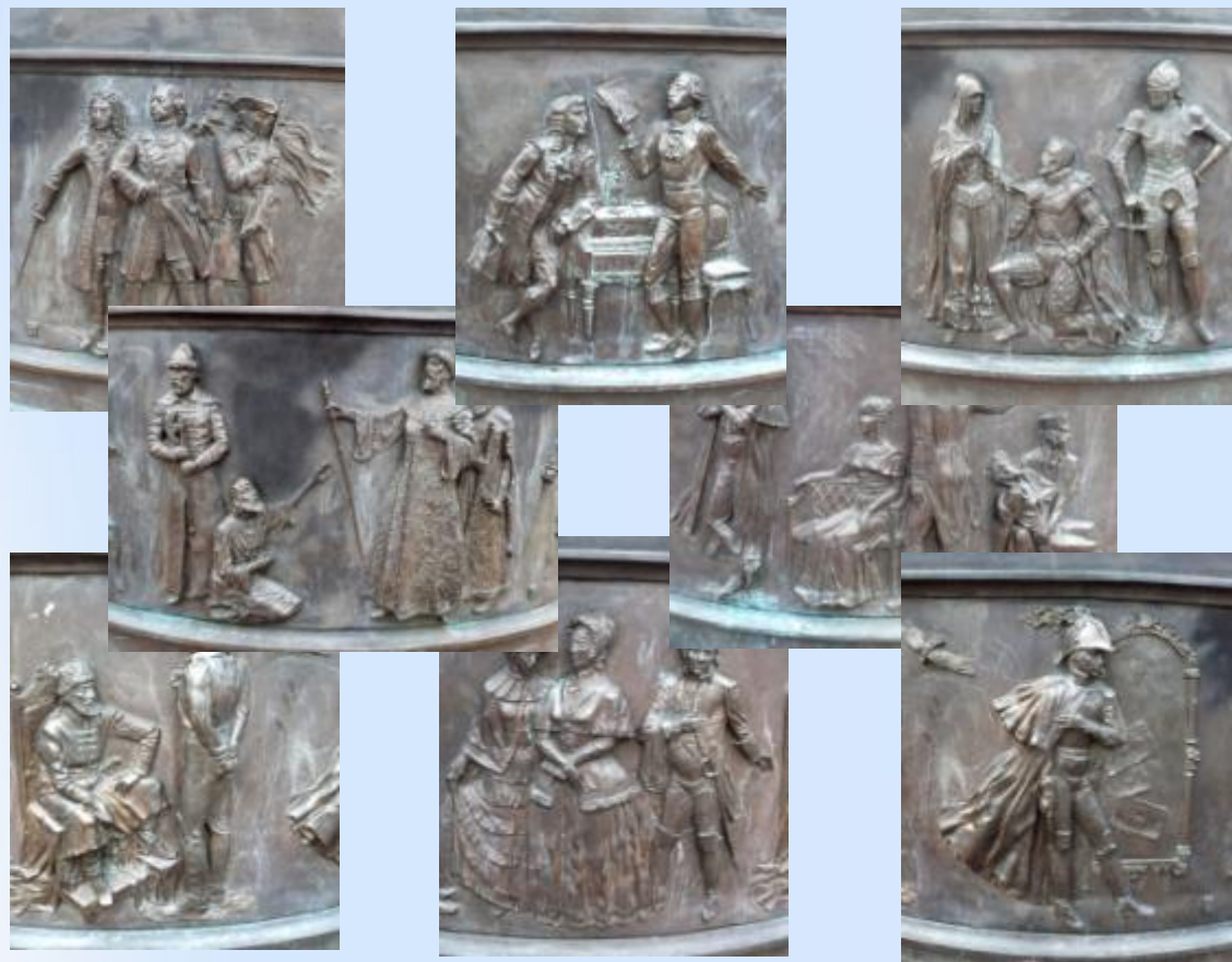
28 пушкинских героев в рельефе постамента памятника А.С. Пушкину на театральной площади Курска.