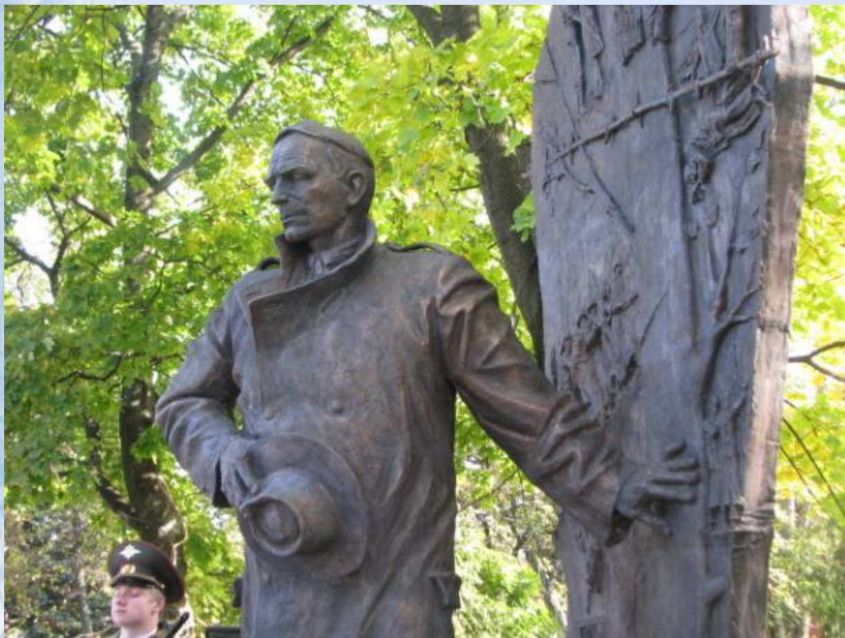
Памятник К.Воробьеву автор скульптор В.И. Бартенев.