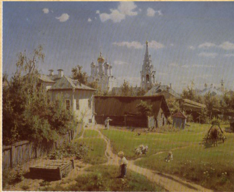
Поленов В.Д. Московский дворик