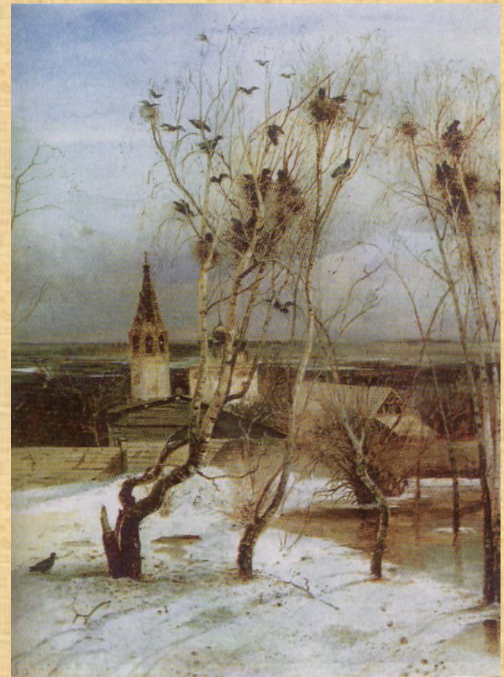
Алексей Саврасов. Грачи прилетели