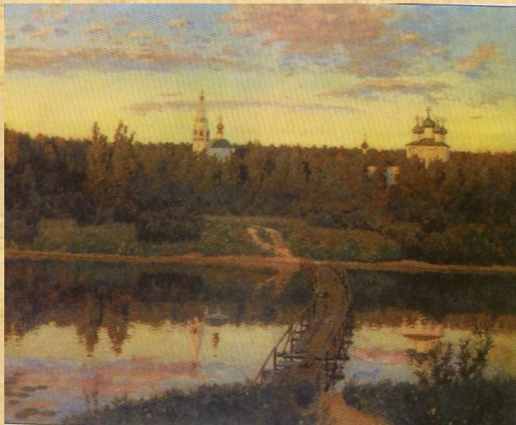
Исаак Левитан. Тихая обитель