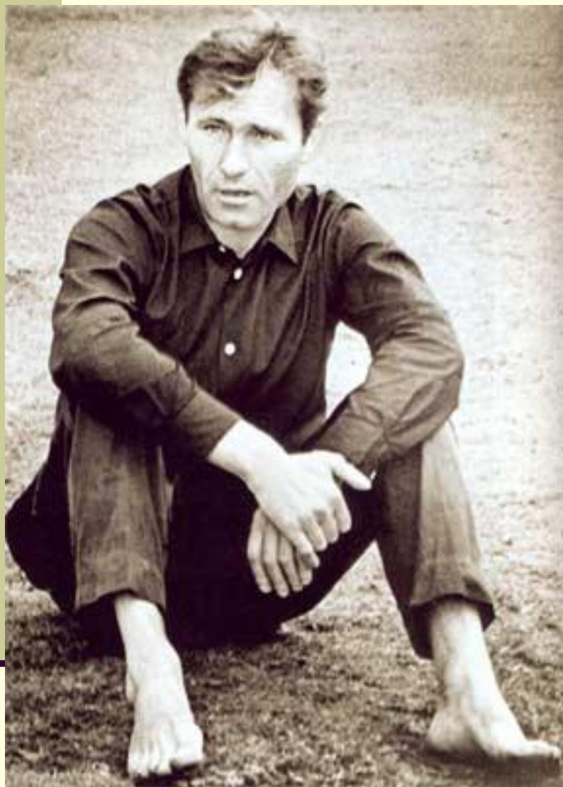
Василий Макарович Шукшин