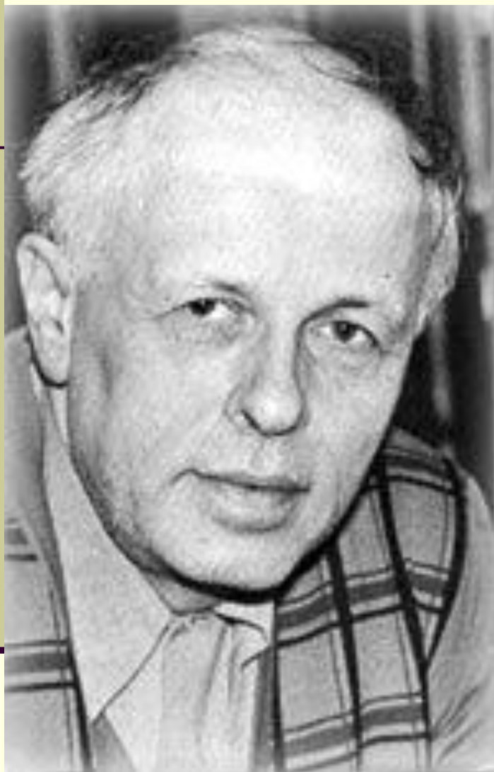
Андрей Дмитриевич Сахаров