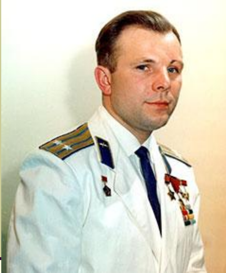
Юрий Алексеевич Гагарин