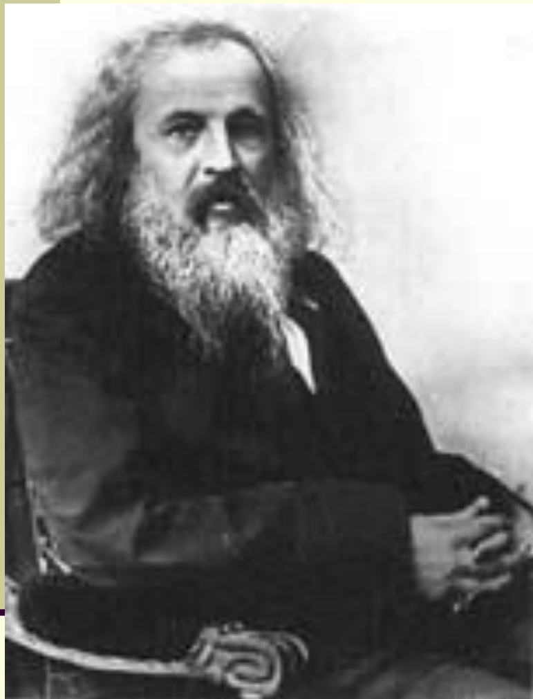
Дмитрий Иванович Менделеев