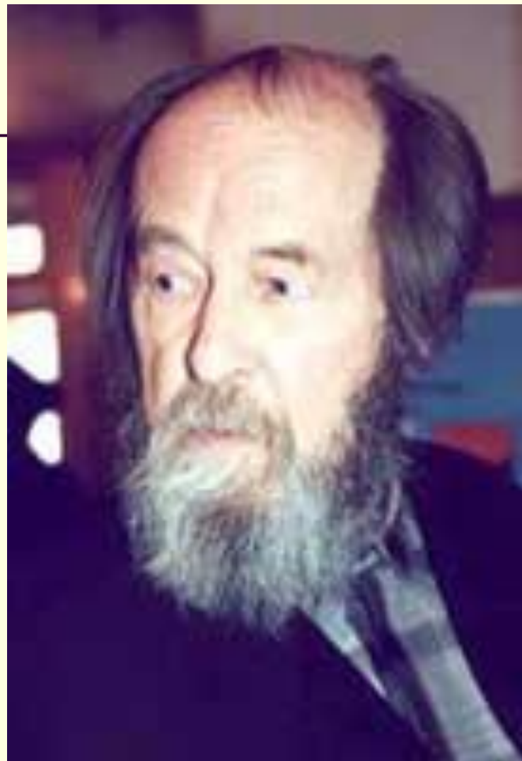
Александр Исаевич Солженицын