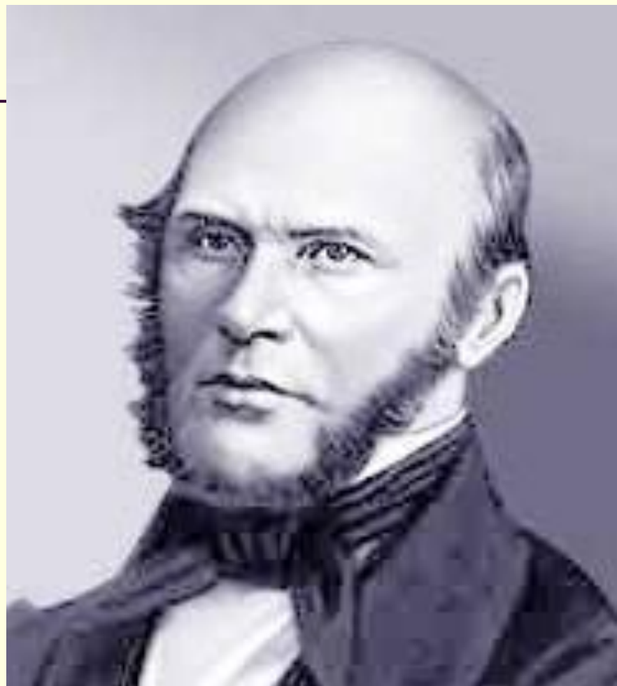
Николай Иванович Пирогов