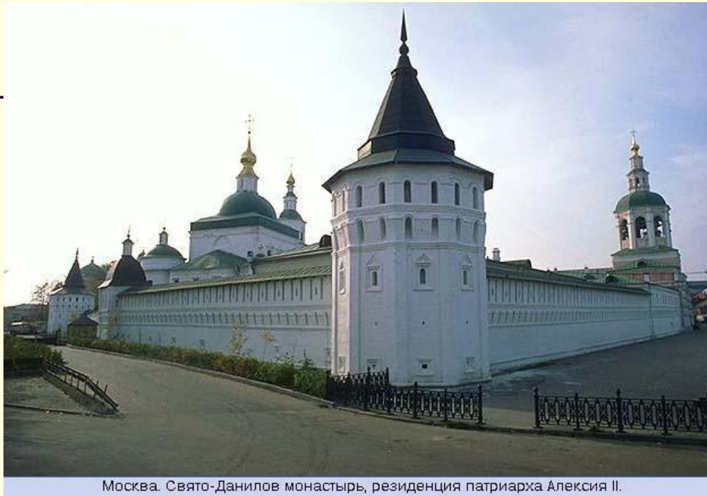
Москва. Свято-Данилов монастырь, резиденция патриарха Алексия II.