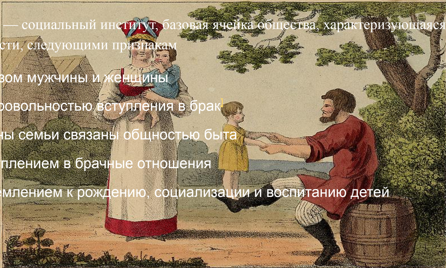
THE MOUJICK AND FAMILY.

стремлением к рождению, социализации и воспитанию детей