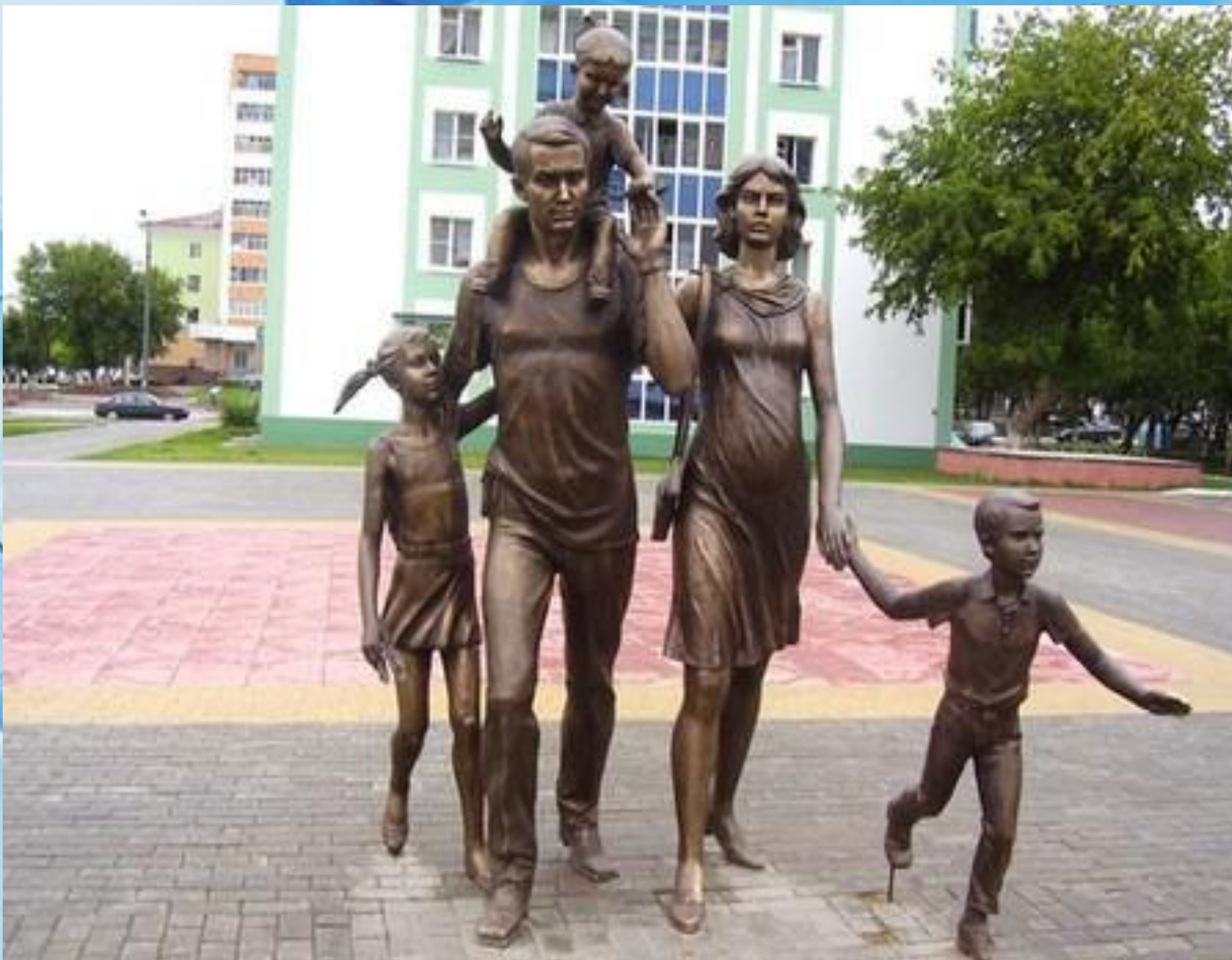
Памятник семье в Саранске