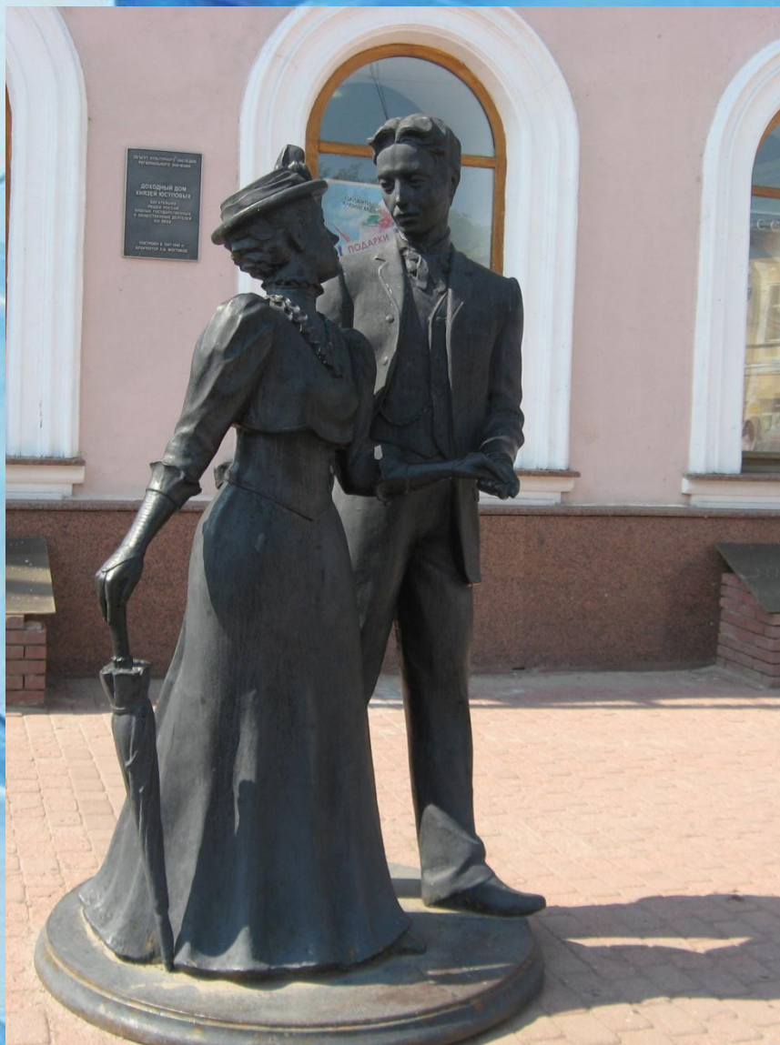
Скульптура в Нижнем Новгороде