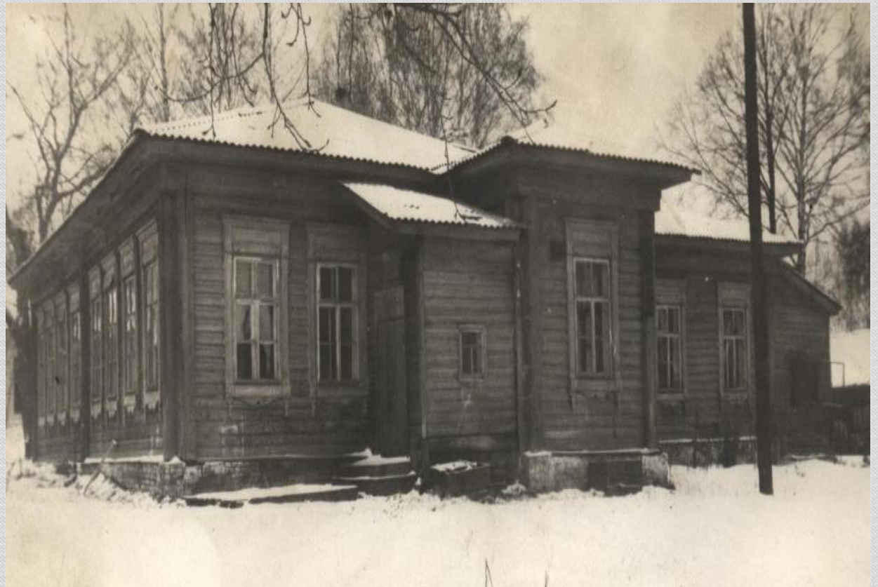
ТИПОВОЕ ДВУХКЛАССНОЕ УЧИЛИЩЕ

В 1910 году в деревне Русский Кукмор на средства земства строится типовое двухклассное училище, его строительство было закончено к началу 1913 года.