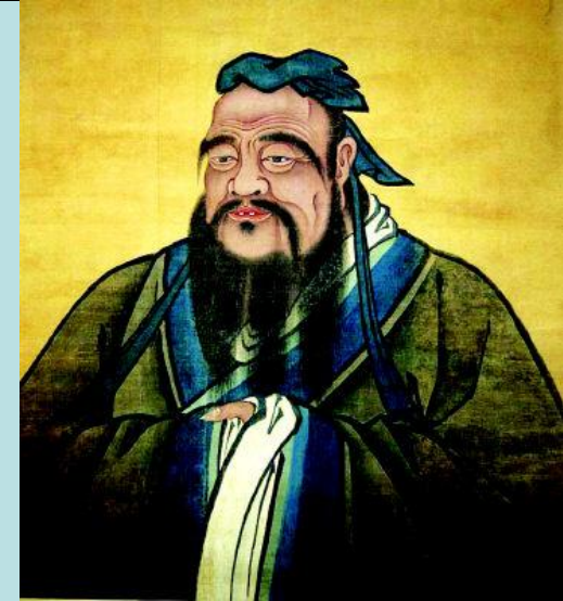
Конфуций (551-479 гг. до н. э.)