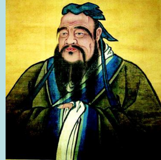
Конфуций (551-479 гг. до н. э.)