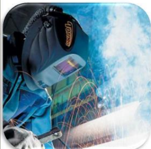
ЗАЩИТА ЛИЦА ПРИ СВАРКЕ