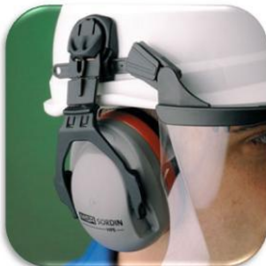
ЗАЩИТА ОРГАНОВ СЛУХА