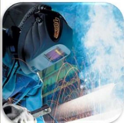
ЗАЩИТА ЛИЦА ПРИ СВАРКЕ