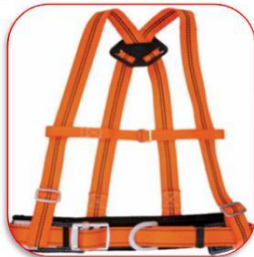
ПОЯСА И ПРИВЯЗИ