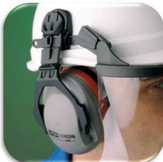
ЗАЩИТА ОРГАНОВ СЛУХА