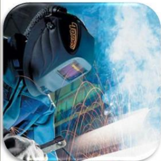
ЗАЩИТА ЛИЦА ПРИ СВАРКЕ