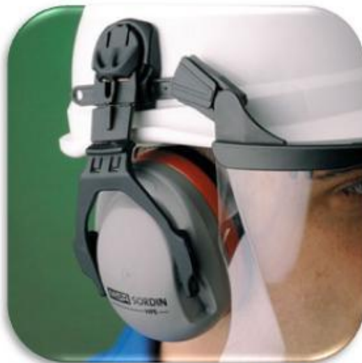
ЗАЩИТА ОРГАНОВ СЛУХА