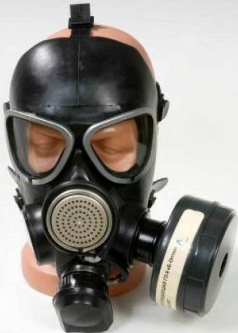
лицевая часть МП-04