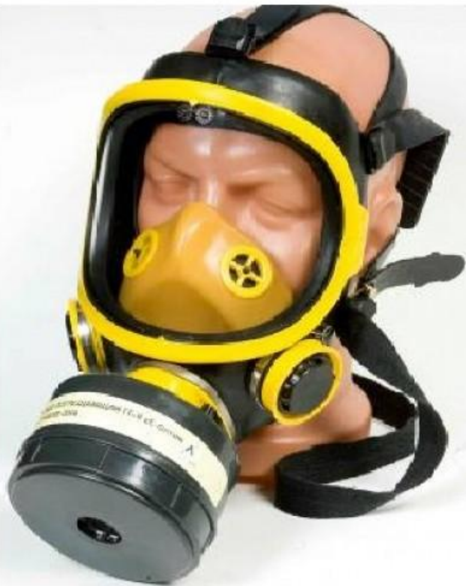
полнолицевая маска МПГ-Изод