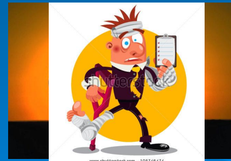
с человеком может произойти несчастный случай