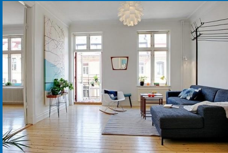
у него есть дом (квартира),