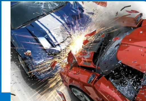
машина, может попасть в серьезное ДТП