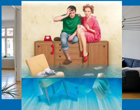
Квартиру затопить водой

И в один момент может произойти что-то, что неумолимо кинет все его старания вниз (не дай Бог, конечно)