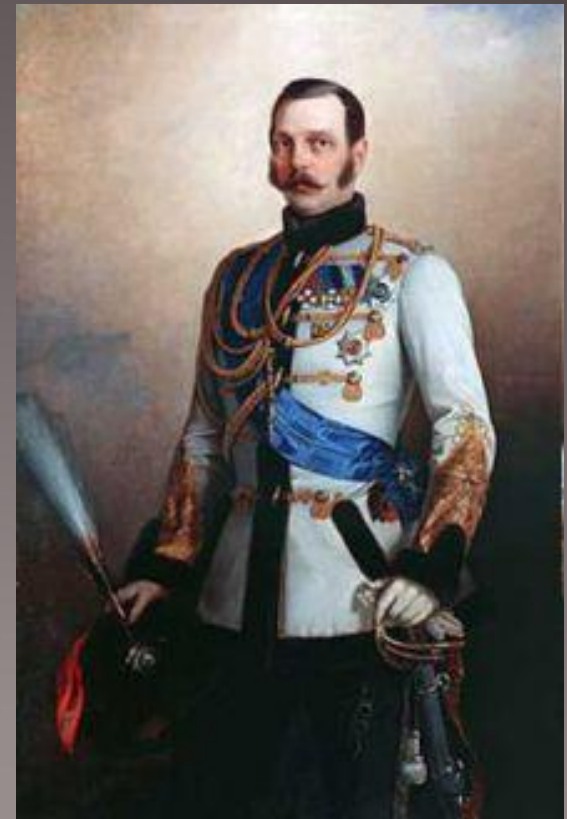
Портрет Александра II

Новые судебные учреждения создавались императорским манифестом от 20 ноября 1864 года. Там же подчеркивалось, что власть вновь создаваемых судов распространяется «на лица всех сословий и на все дела, как гражданские, так и уголовные». Сохранялся при этом, впрочем, и ряд особых судов — духовные, военные, коммерческие, волостные для крестьян и «инородческие». Гласность, устность и состязательность процесса — вот что отныне поднималось на щит.