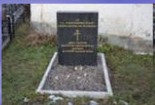
Памятник венгерским военнопленным.