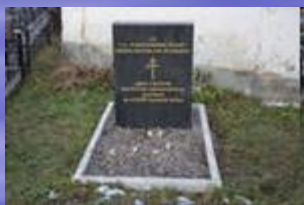
Памятник венгерским военнопленным.