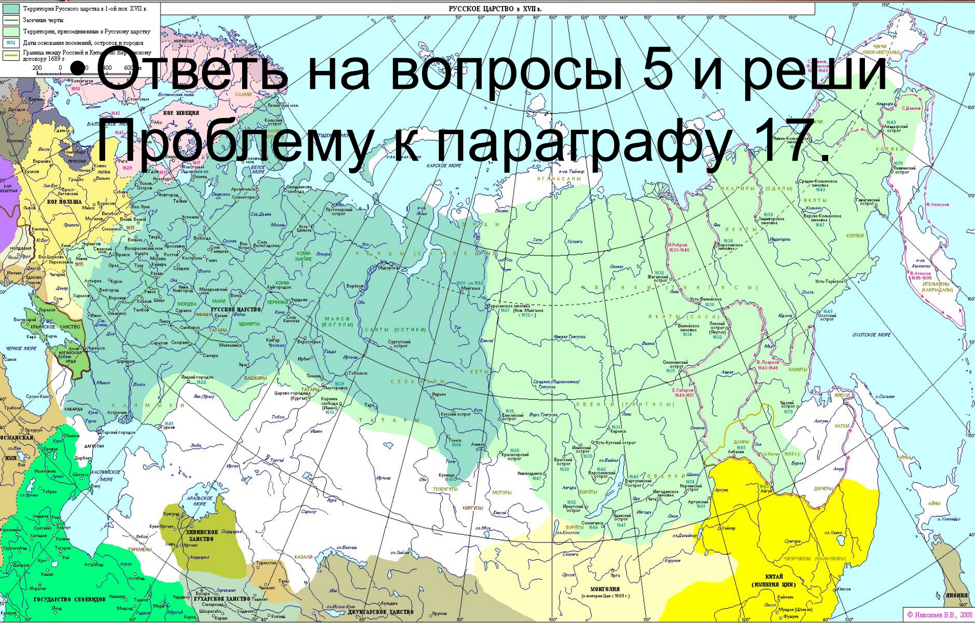
РУССКОЕ ЦАРСТВО в XVII в.

• Ответь на вопросы 5 и реши Проблему к параграфу 17.