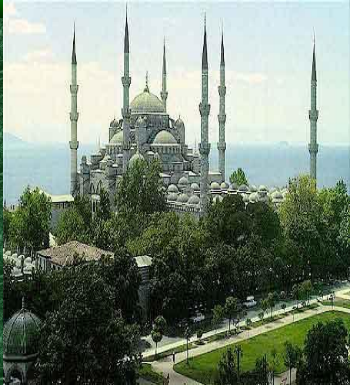
Мечеть (молитвенное здание)