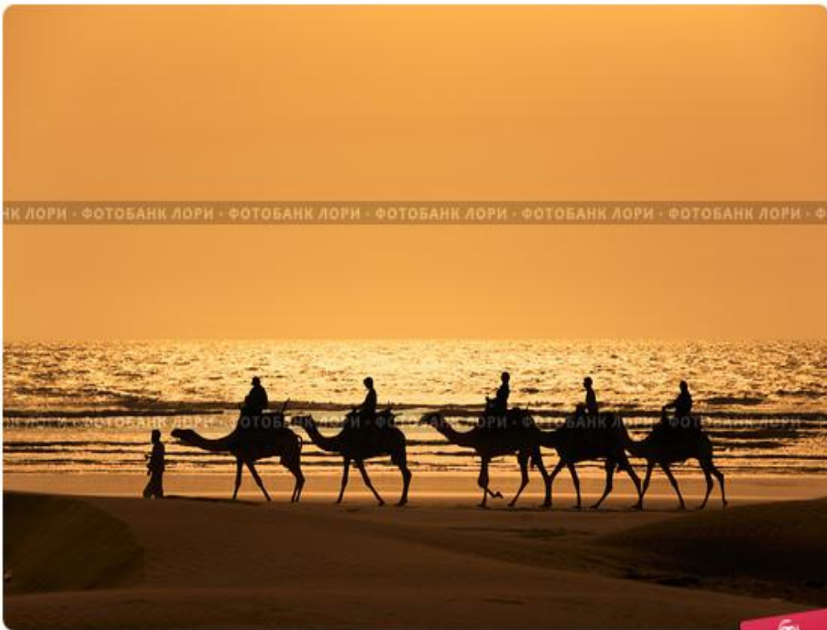
Силуэты людей на верблюдах идущих вдоль берега океана на закате солнца

Через купцов он познакомился с религиями, а женитьба на богатой вдове Хадидже позволила ему заниматься тем, к чему он был призван: осмысление религиозных проблем, проблем жизни общества.