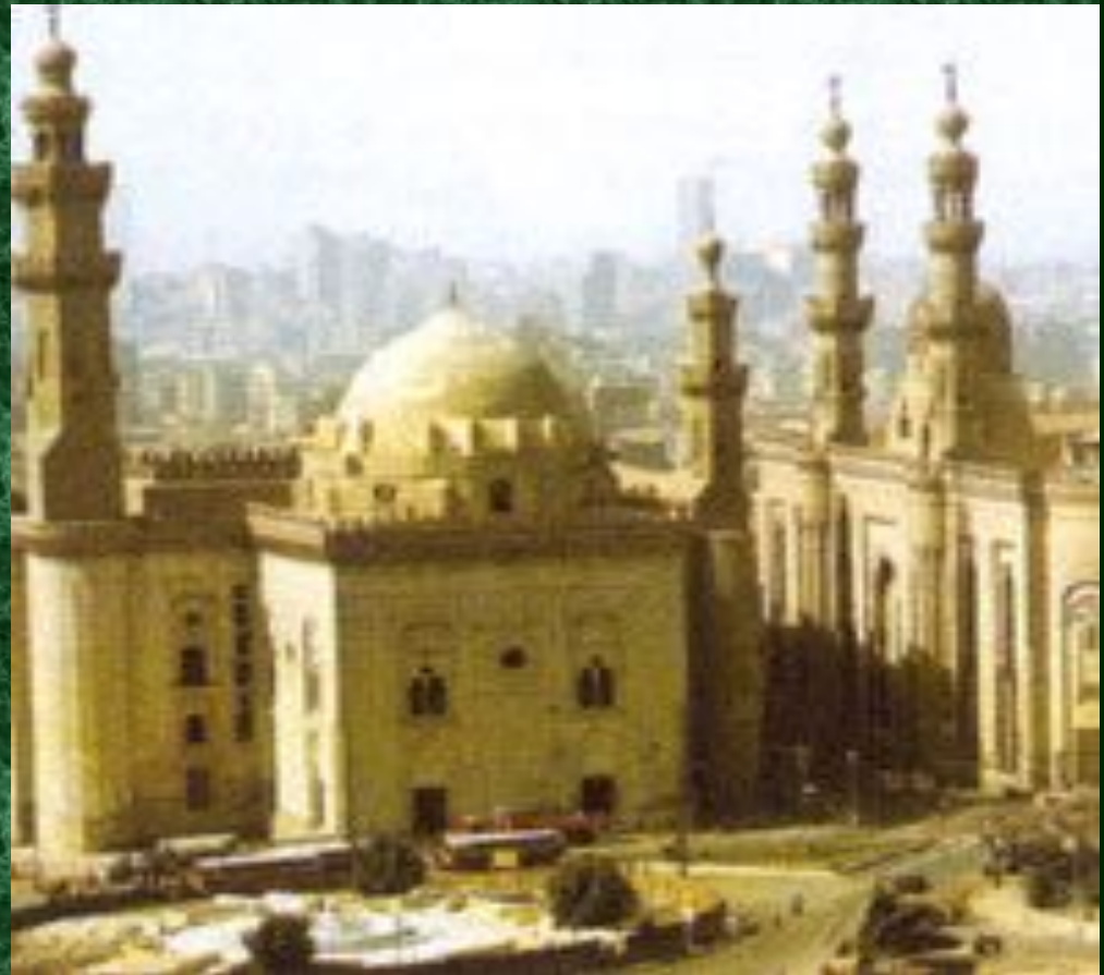
Мечеть (молитвенное здание)

Он родился в Мекке в 570 г. Мухаммед принадлежал к обедневшему роду хашим. Рано осиротев, он жил в семье своего деда, потом дяди. У него были трудные детство и юность: он пас овец, в 25 лет сопровождал караваны.