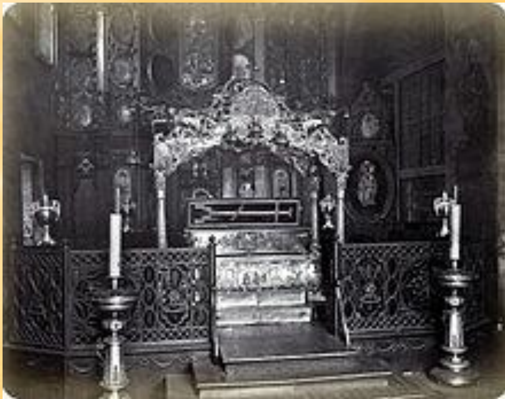
Рака с мощами св. Варвары в Златоверхом монастыре, фото 1872 года