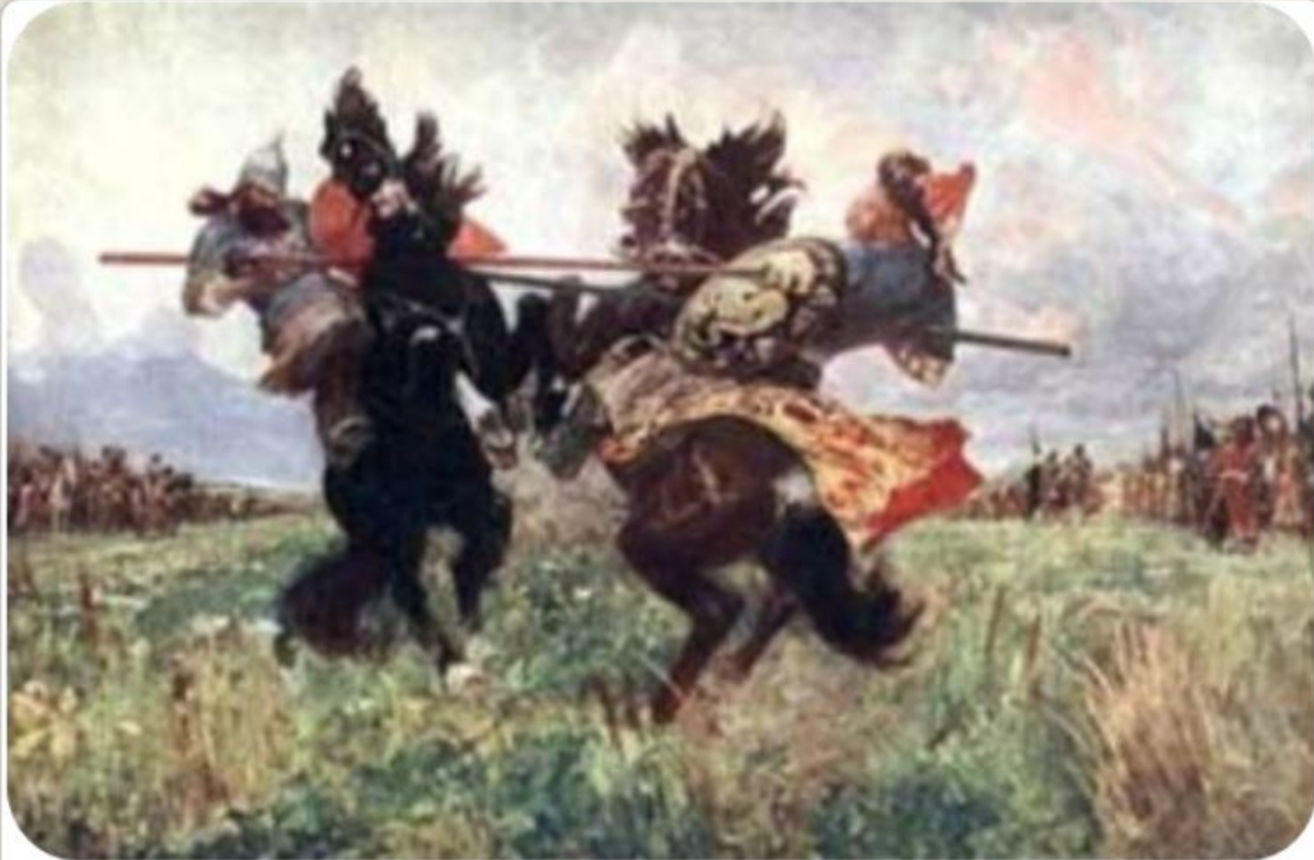
М.Авилов. Поединок Пересвета с Челубеем