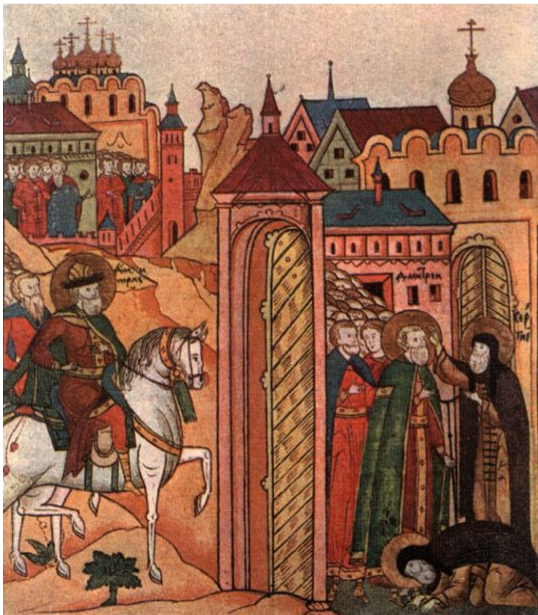
Дмитрий Донской у Сергия Радонежского. Миниатюра из лицевого «Житии Сергия Радонежского»