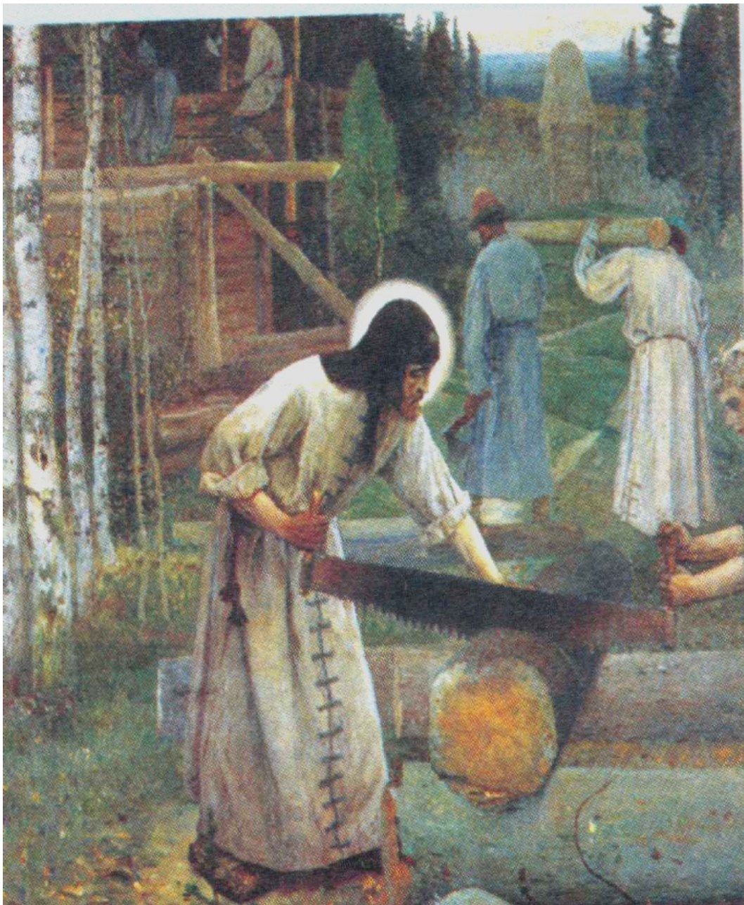
М.В.Нестеров «Труды преподобного Сергия»