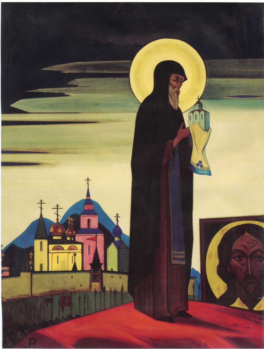
Н.К.Рерих «Святой Сергий»