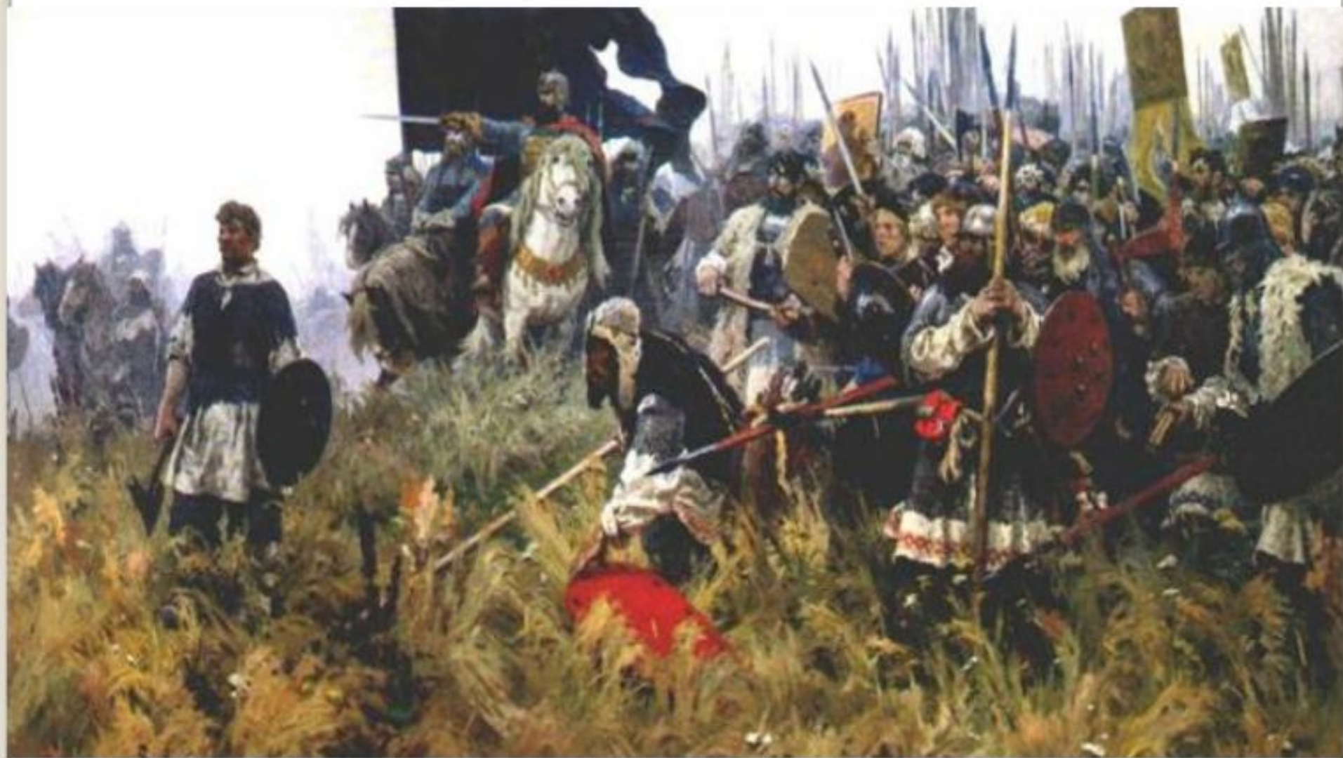
А.П.Бубнов. «Утро на Куликовом поле»