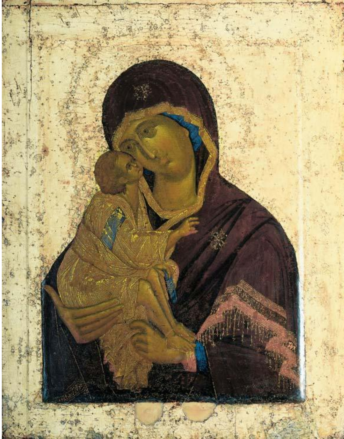
Донская икона Божией Матери. XIV в.