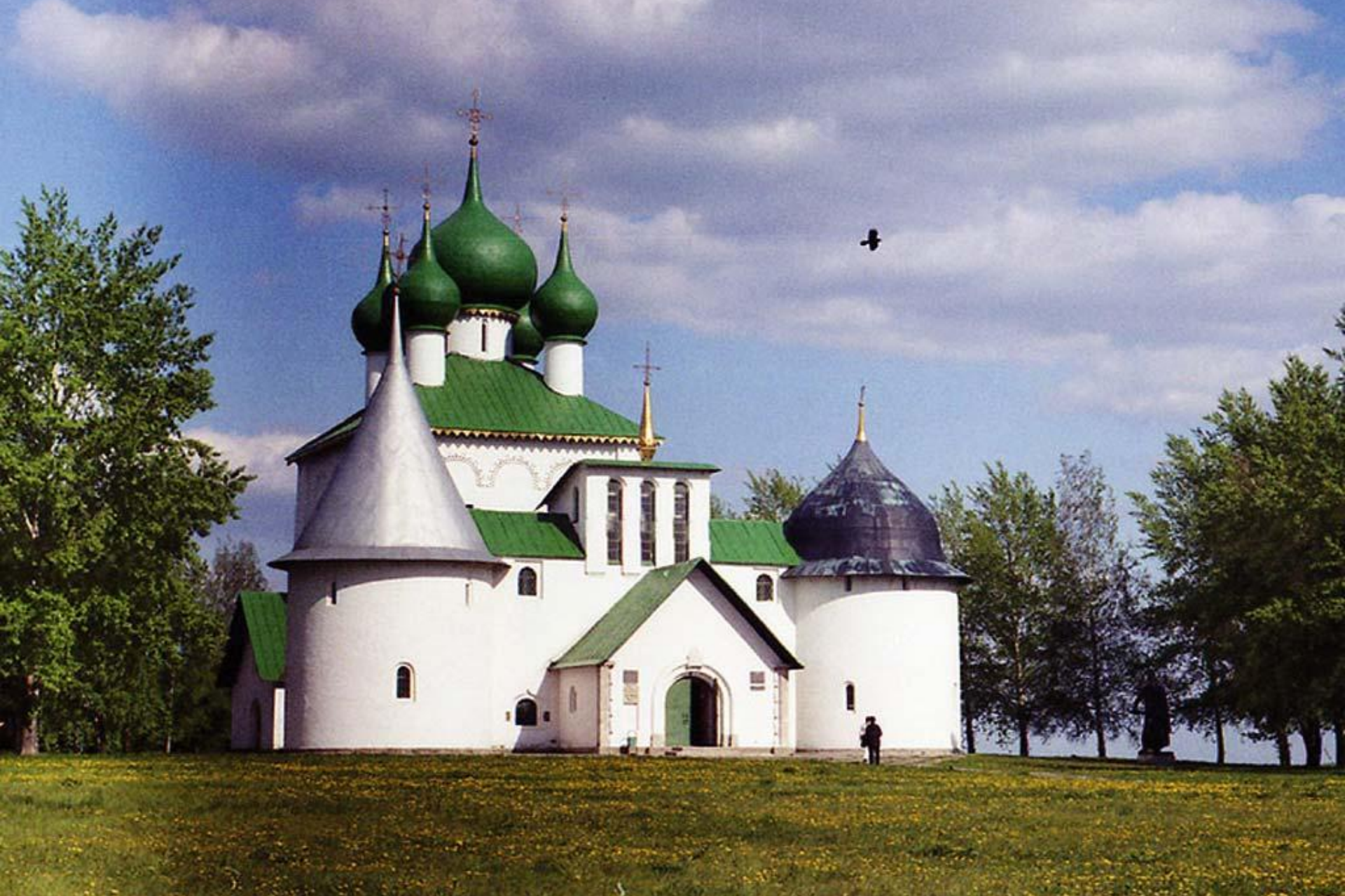
Храм-памятник Преподобному Сергию Радонежскому на поле Куликовом. Построен в 1913–1919 гг.