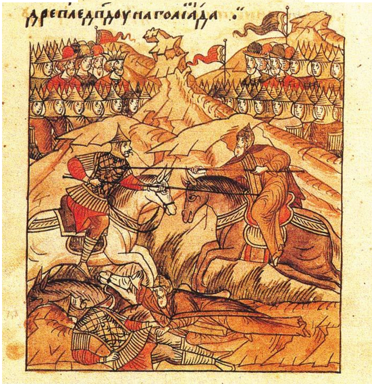
Поединок монаха Пересвета с Темир-мурзой. Летописная миниатюра