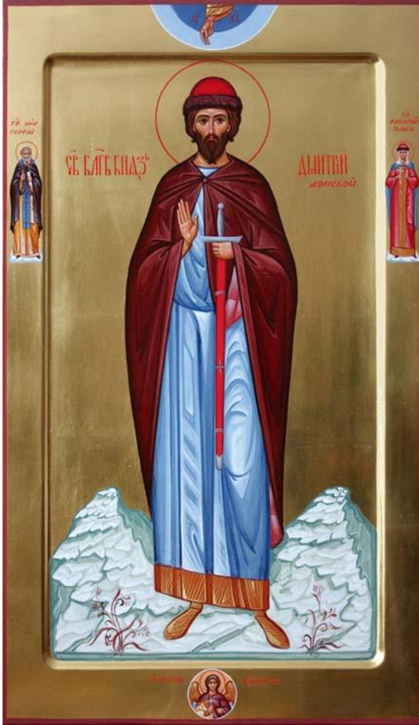
Святой благоверный князь Димитрий Донской. Икона XX в.