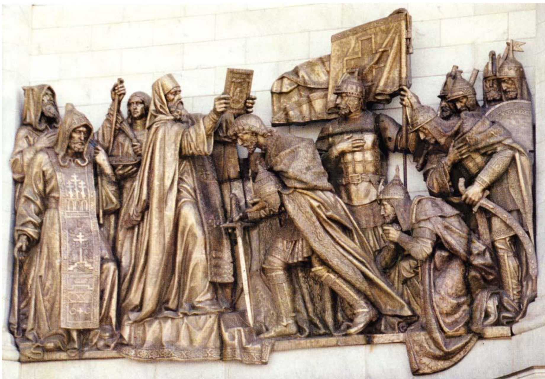
Святой Сергий Радонежский благословляет Дмитрия Донского на битву с Мамаем. Горельеф Храма Христа Спасителя. Москва