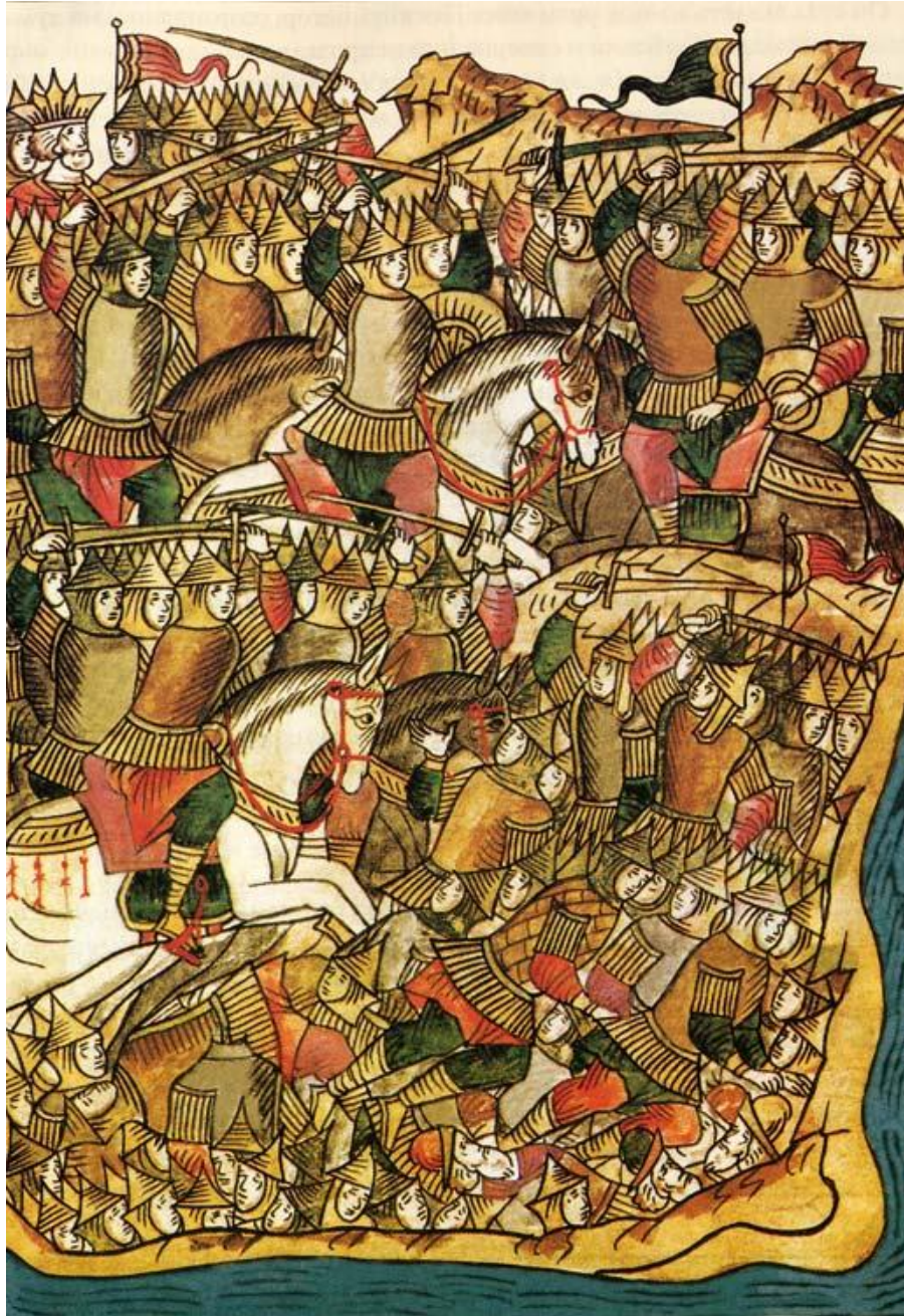
Куликовская битва. Летописная миниатюра