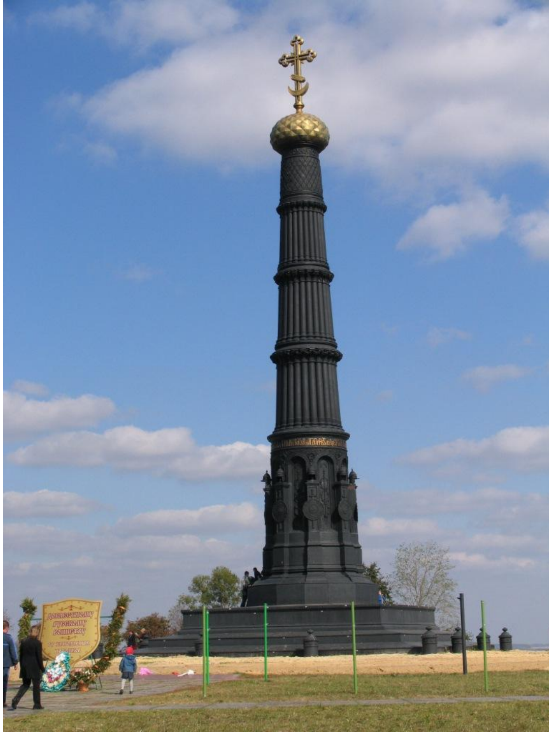
Памятник князю Димитрию Донскому на поле Куликовом