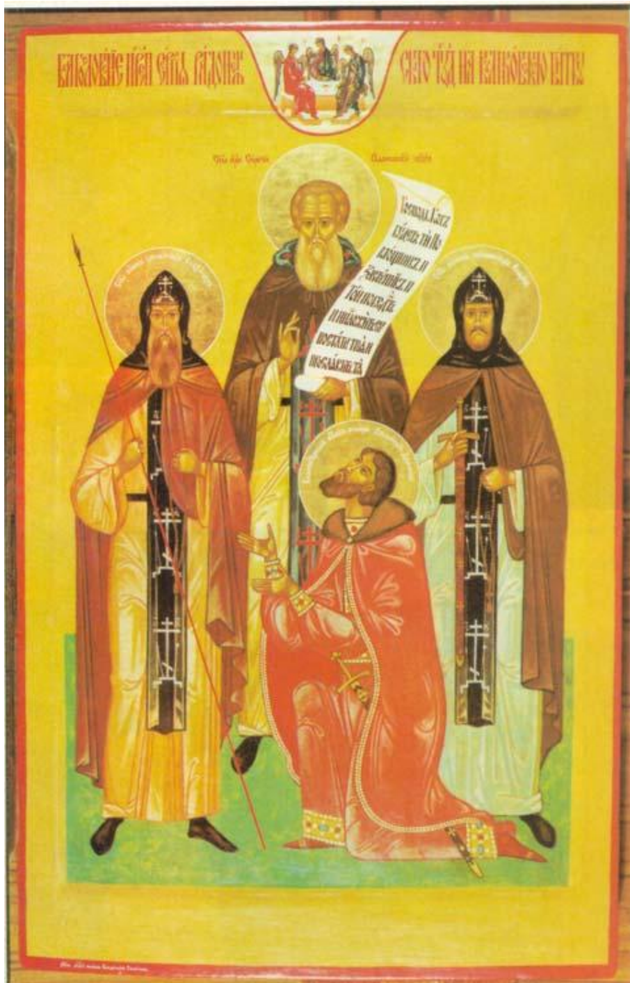
Благословение Преподобного Сергия Радонежского на Куликовскую битву. Икона 1980 г.