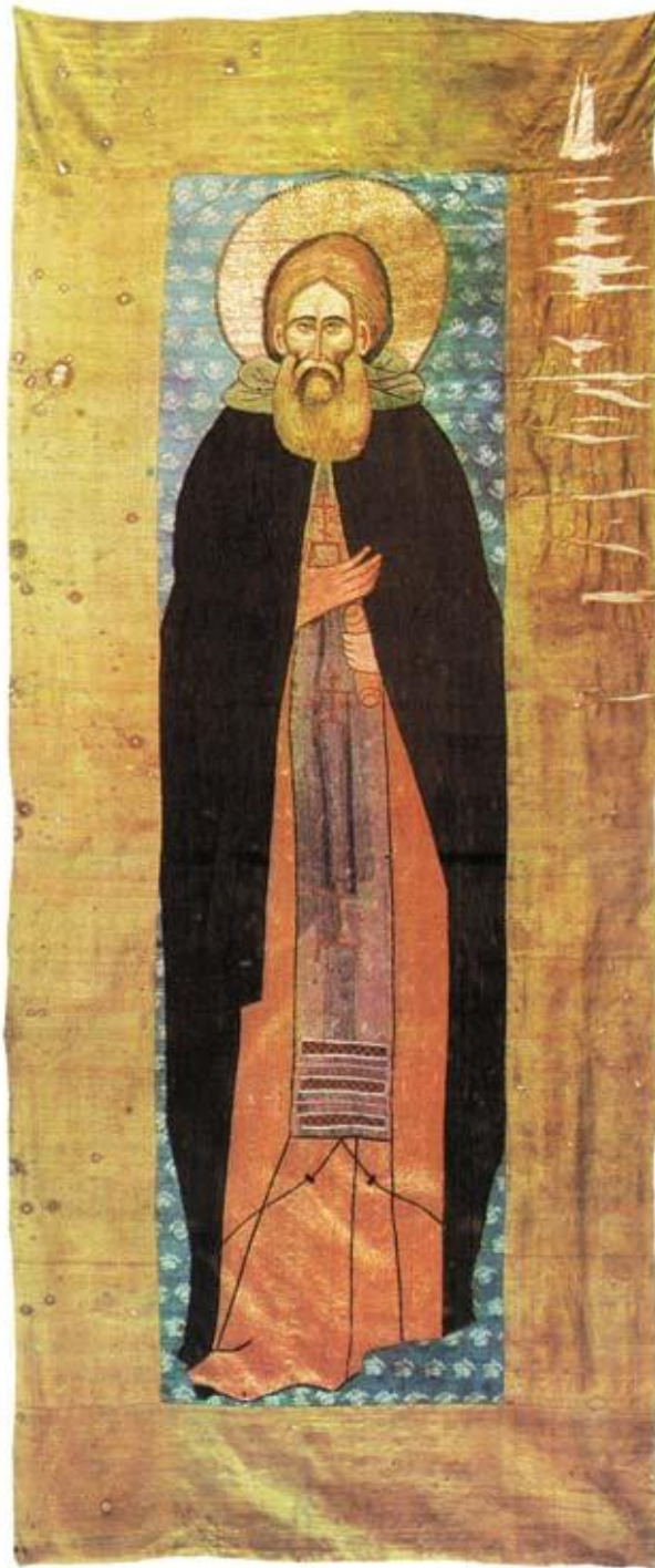
Тканый покров с изображением Святого Сергия. Подарок Троице-Сергиеву монастырю от внука князя Дмитрия Донского