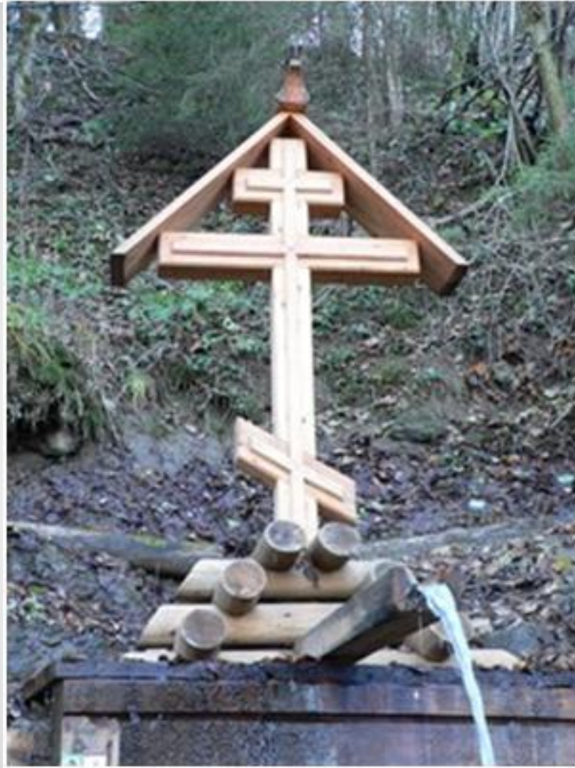
Крест над святым источником