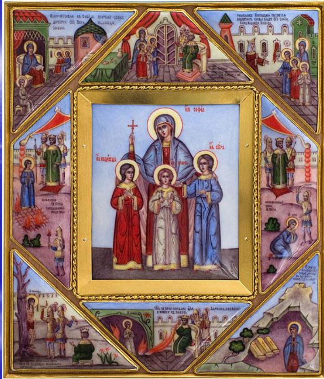
Народные обычаи и приметы в день мучениц Веры, Надежды, Любви и матери их Софии