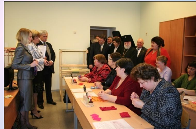
В настоящее время в здании располагаются мастерские отделения Православной педагогики Тамбовского педагогического колледжа