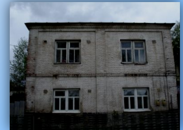
Здание в настоящее время