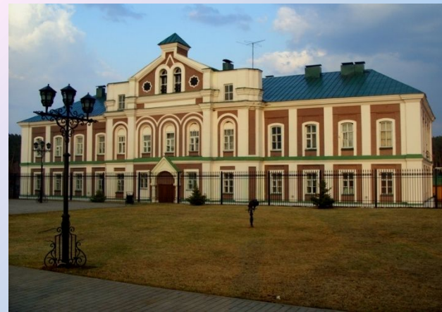
Здание бывшего женского монастыря