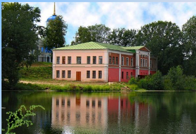
Бывшее здание школы (до 2009 года), в котором в 1879 году был открыт приют для девочек

2 декабря 1879 г. Указом Св. Синода в с. Тулиновка была учреждена женская община и одновременно при ней открыт приют для девочек. Все было переименовано в женский монастырь , которому передали приходскую Успенскую церковь.