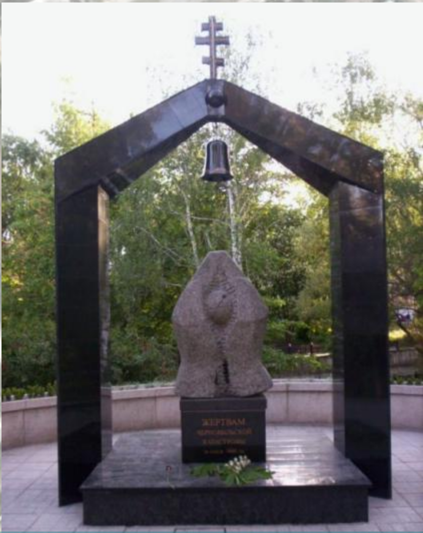
Памятник ликвидаторам ЧАЭС г. Богуслав, Киевская область.