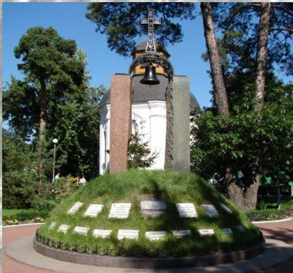
Мемориал "Героям–Чернобыльцам" в городе-герое Киеве (сквер на бульваре Верховной Рады)