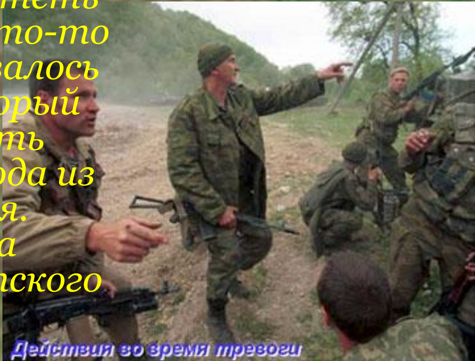
Действия во время тревоги