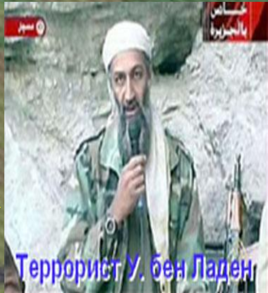
Террорист У. бен Ладен