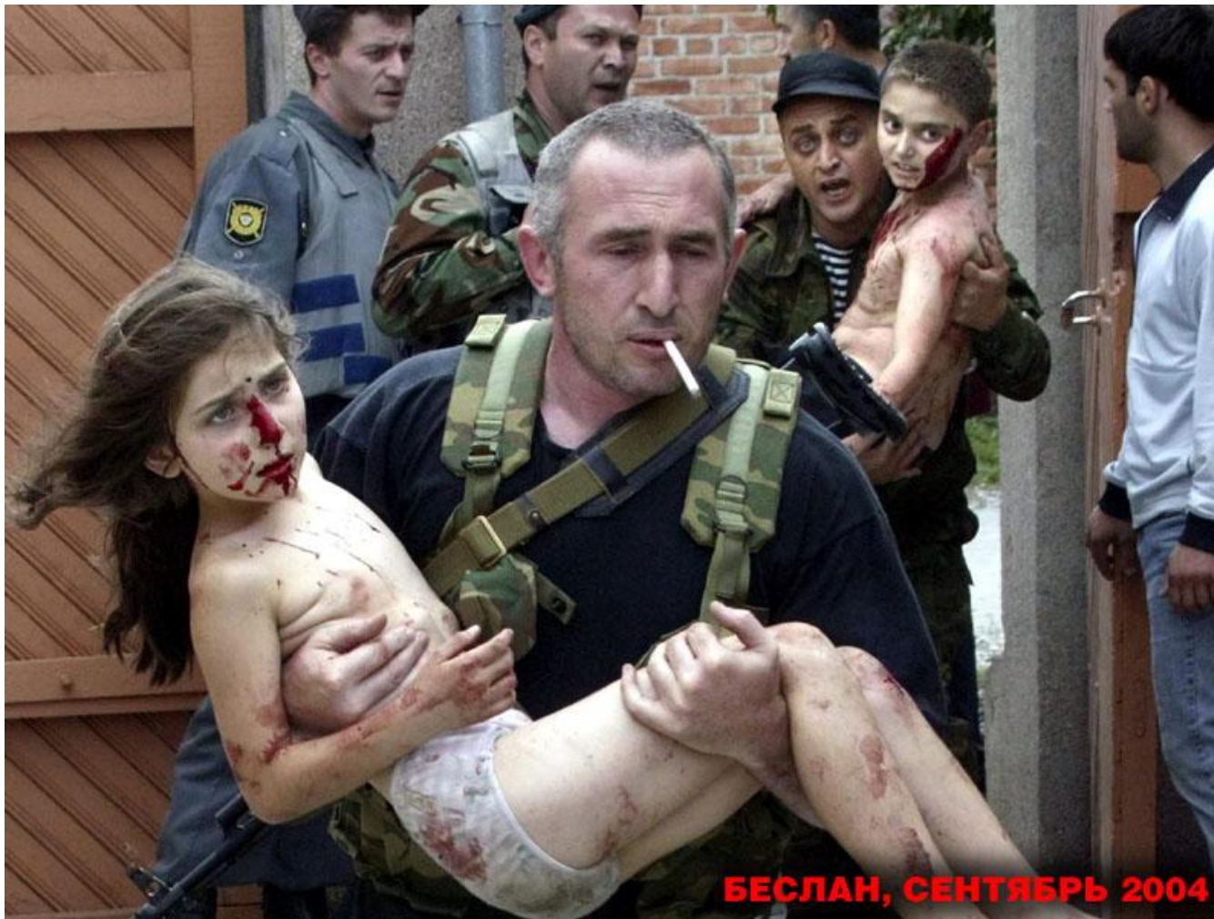
БЕСЛАН, СЕНТЯБРЬ 2004