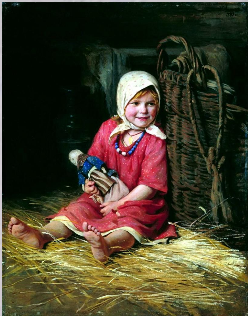
ЛЕМОХ Карл Варька