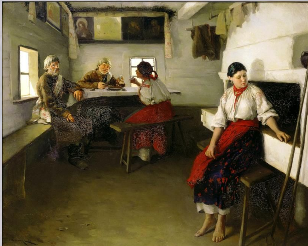
ПИМОНЕНКО Николай Сваты