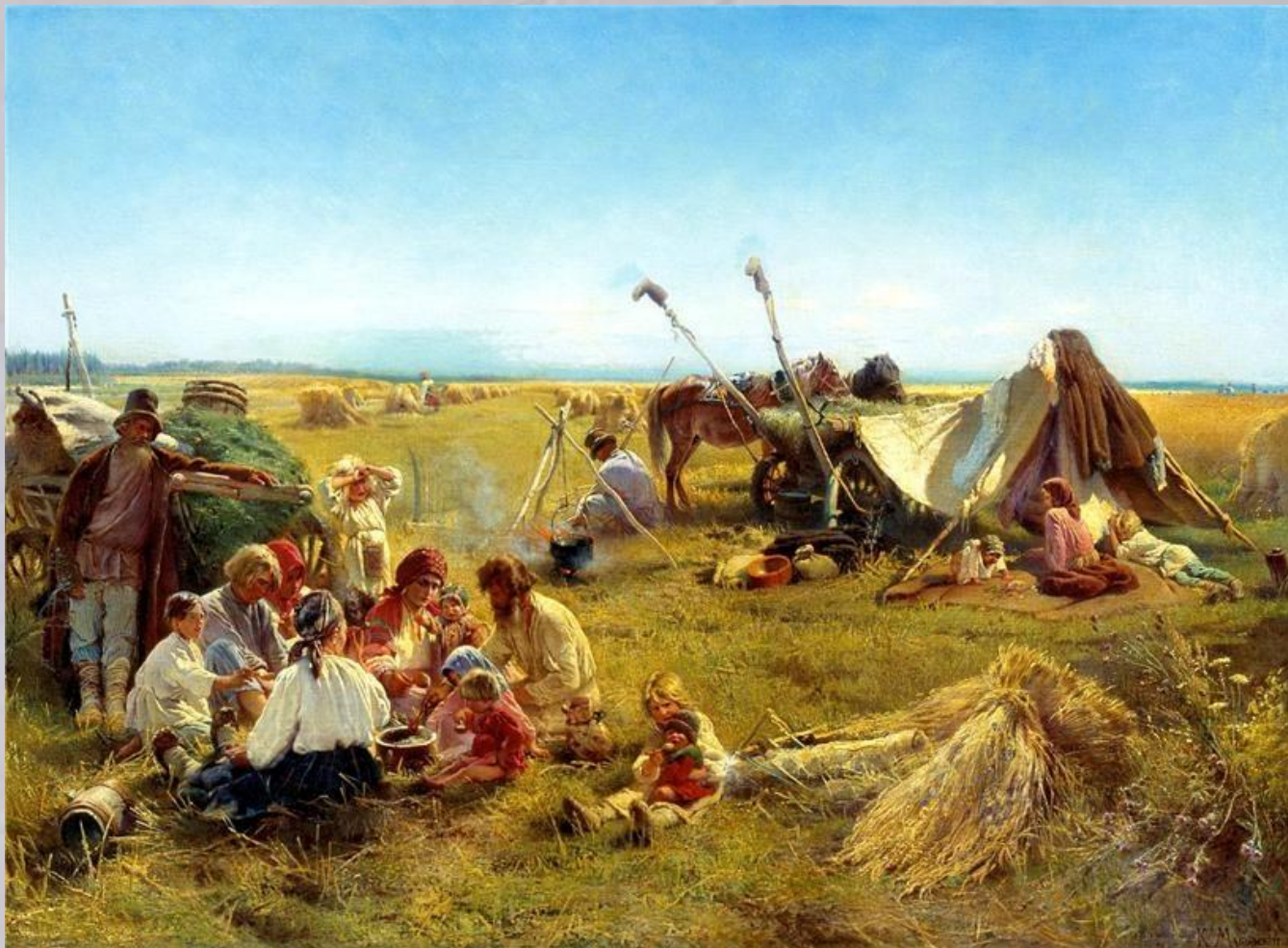
МАКОВСКИЙ Константин Крестьянский обед в поле