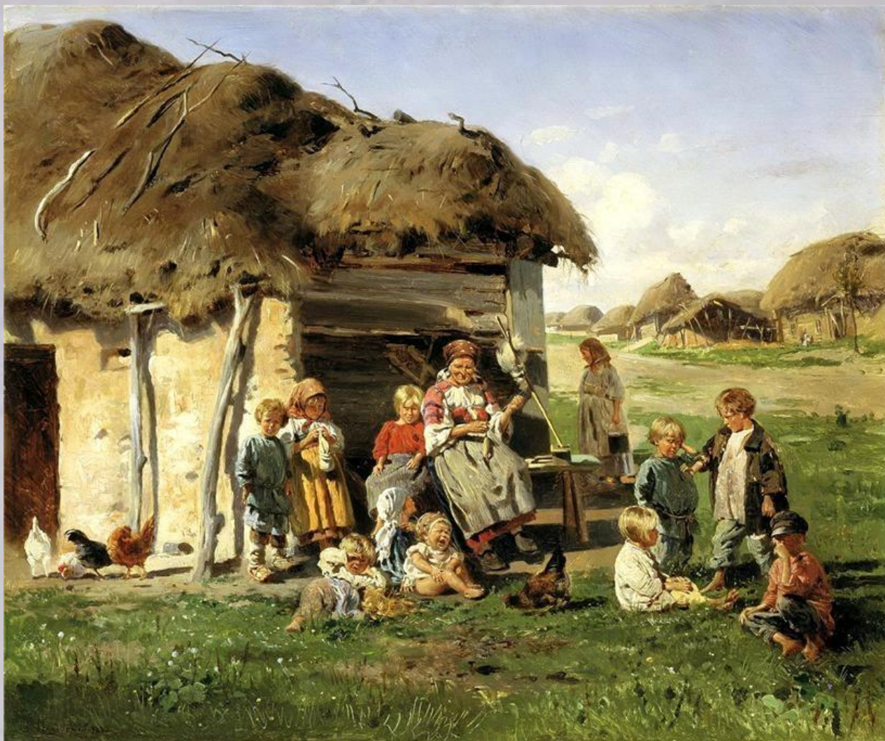
МАКОВСКИЙ Владимир - Крестьянские дети