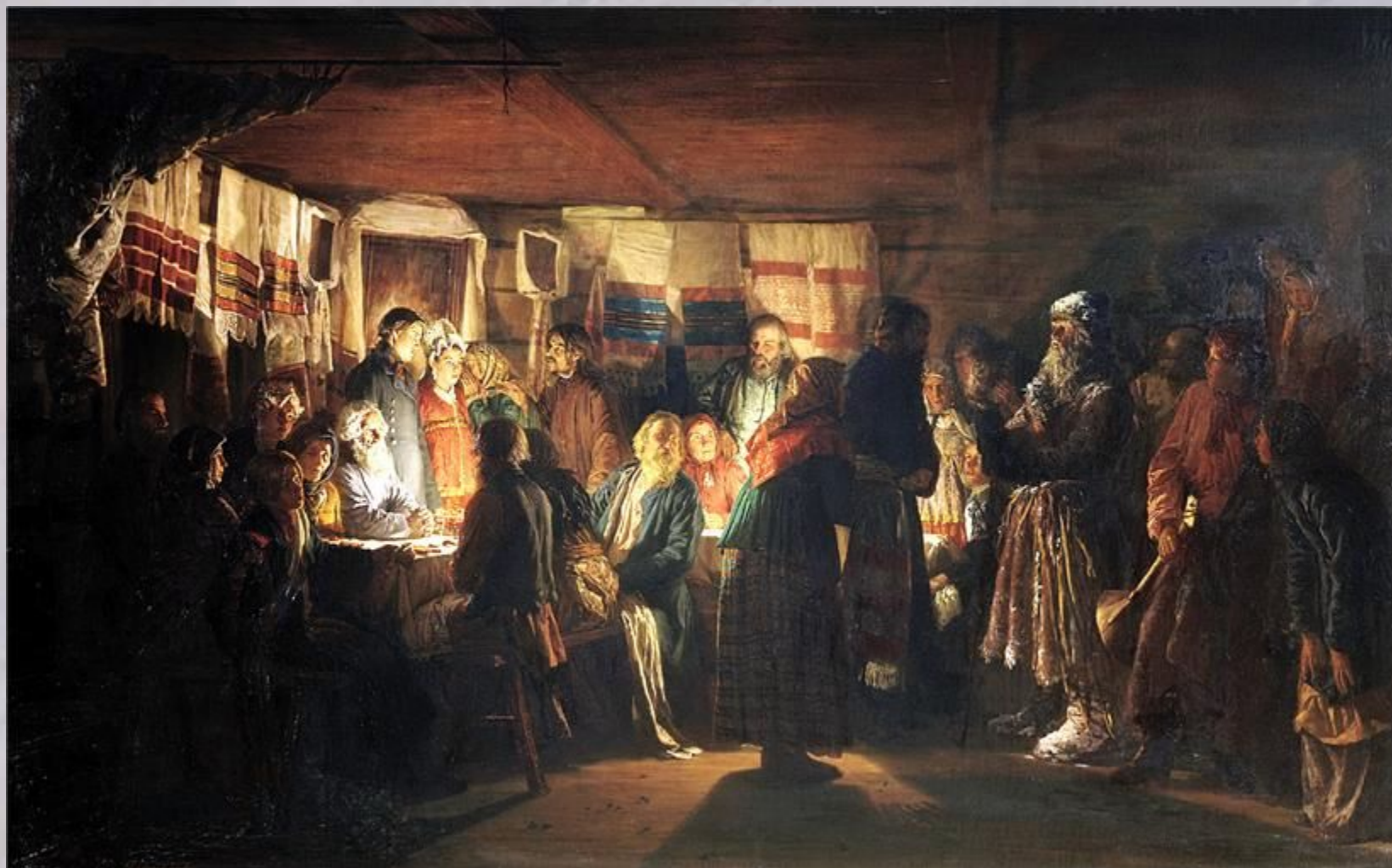
МАКСИМОВ Василий Приход колдуна на крестьянскую свадьбу