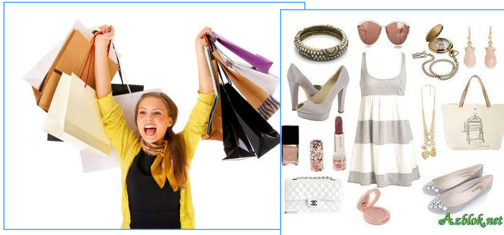
Красивая одежда и ювелирные украшения